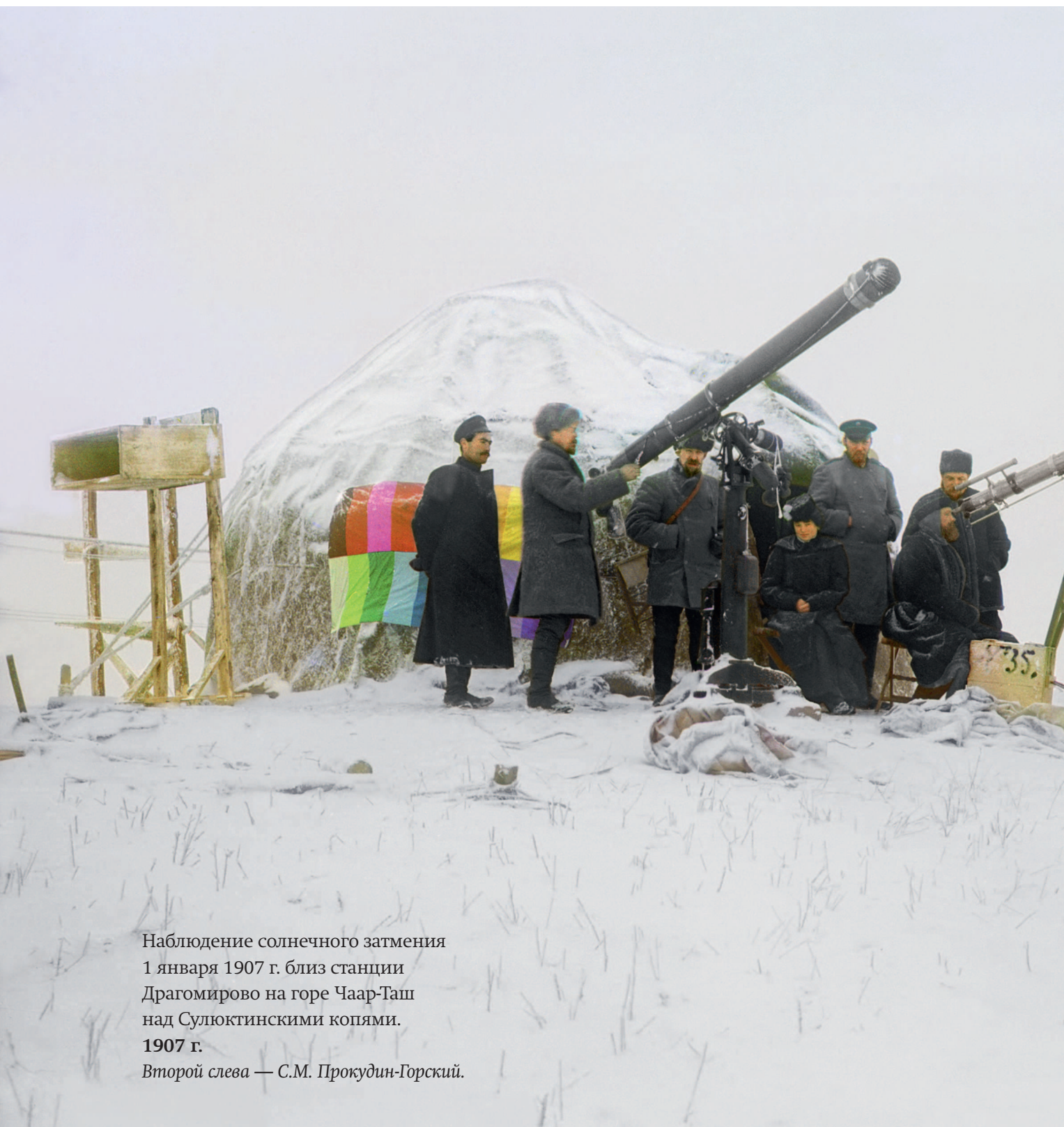
Наблюдение солнечного затмения 1 января 1907 г. близ станции Драгомирово на горе Чаар-Таш над Сулюктинскими копиями. 1907 г.