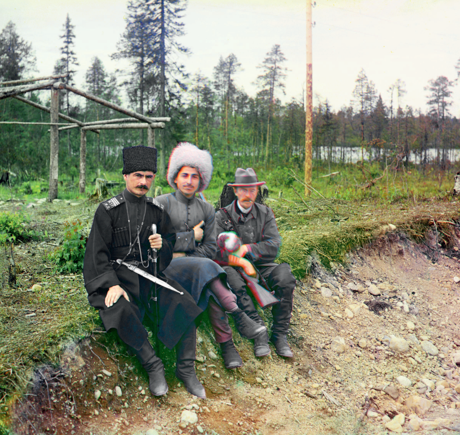
С.М. Прокудин-Горский с попутчиками у линии Мурманской железной дороги.