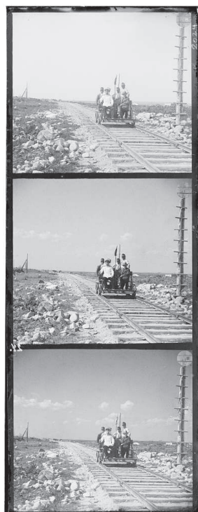
С.М. Прокудин-Горский на дрезине движется по Олонецкой железной дороге у Петрозаводска. 1916 г.

Сейчас имя Сергея Михайловича Прокудина-Горского (1863–1944) известно многим. А лет 40–50 назад о нем знали разве что редкие специалисты. Да и история фотографии в качестве самостоятельного направления исследований стала стремительно развиваться совсем недавно. Время ушло безвозвратно и унесло с собой тех, кто мог поведать о старой фотографической технике, кто был знаком с мастерами, жившими и творившими в первой половине XX столетия. Способы и средства, которые были призваны сохранять моменты прошлого, оказались в парадоксальной ситуации — они сами нуждаются в сохранении. Фотографии и фотографические техники, как выяснилось, — довольно хрупкий предмет, в каких-то случаях даже более хрупкий, чем то, что было запечатлено на снимках. Приходится многое восстанавливать по косвенным источникам, выискивать сведения о производившихся съемках по редким упоминаниям в местной и центральной периодике, догадываться о существовании утраченных ныне снимков. То, что хотя бы часть обширной коллекции тройных негативов С.М. Прокудина-Горского сохранилась, — уже большое чудо. Сейчас мы знаем несколько имен его соратников и современников, одновременно с ним работавших в области цветной фотографии, но их наследие исчезло, и потому они никому неизвестны.