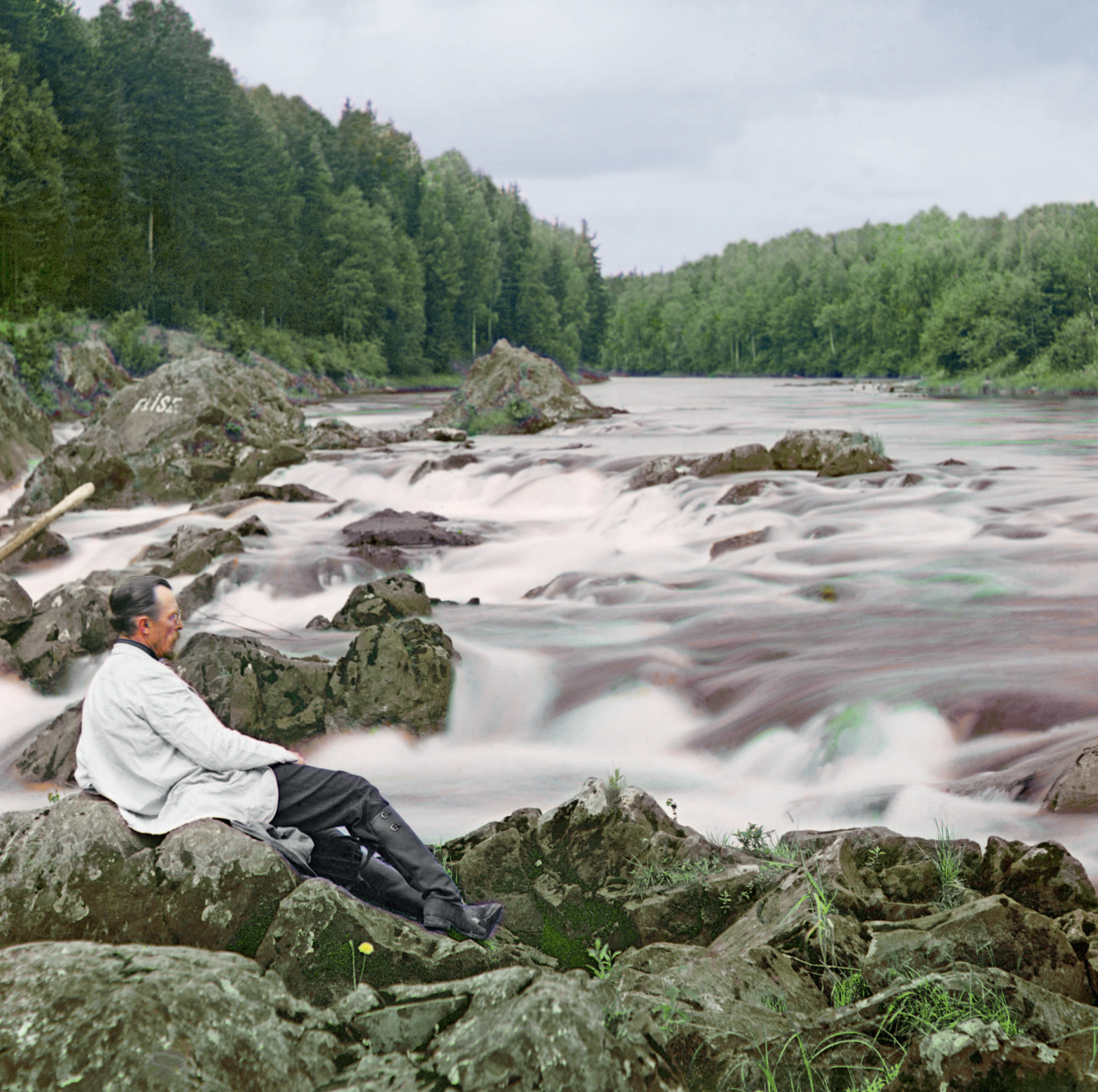
С.М. Прокудин-Горский у водопада Кивач.