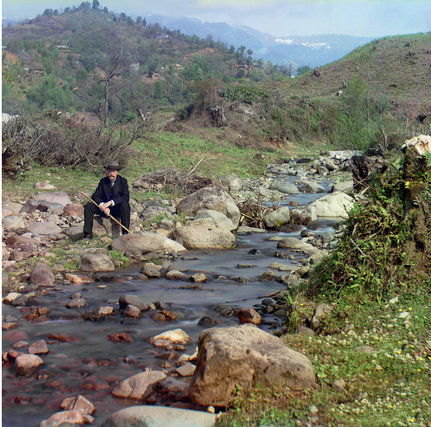
С.М. Прокудин-Горский на реке Скурицхали в Ортабатуме на Кавказе.