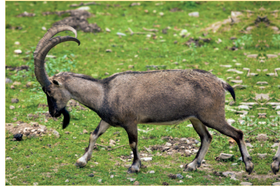
Безоаровый горный козел.