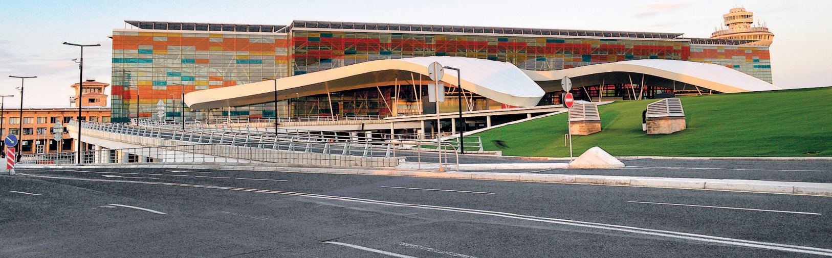
Международный аэропорт Звартноц (сайт: zvartnots.aero ).

Чтобы ответить на этот вопрос, надо вооружиться знаниями о местном климате. Итак, зимой много снега и минусовая температура. Оно вам надо? Летом много туристов. Весна, особенно май, — время цветущих лугов. Многие фотографы едут в Армению именно в мае. Но тут есть один подводный камень — дожди. Если попа-