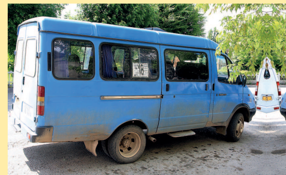
Маршрутка в Гарни.

Основные трассы приемлемого качества, но в глубинке ямы и колдобины — обычное явление.