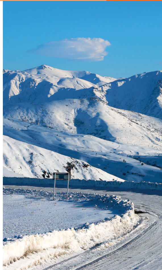
Перевал Селим зимой.

Осадков больше всего выпадает в конце весны — в мае. В июне-июле часто идут ливни. Обычно тучи собираются к середине дня и начинается дождь, зачастую с грозой и градом. Самые сухие месяцы — август и сентябрь.