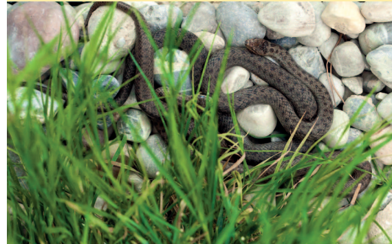
Гладкая змея ( Coronella austriaca ).

ная растительность. В первом случае преобладающими видами являются астрагалы и подушковидные колючки, а во втором преобладают ковыльно-типчаковые сообщества, хотя земли сейчас в основном все распаханы.