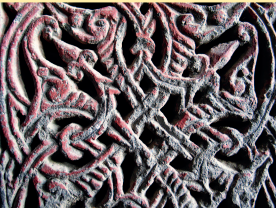
Орнамент на стенах древних храмов.