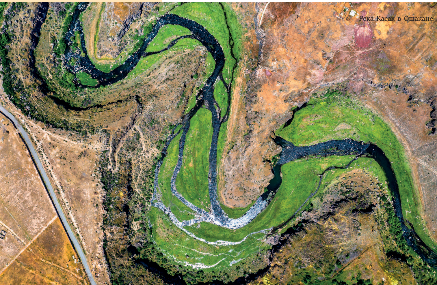
Река Касах в Ошакане.

Бассейн со скульптурами дельфинов в Арзни.