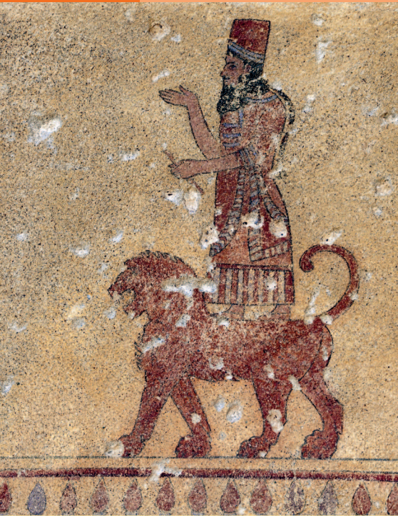
Фреска в крепости Эребуни, 782 г. до н. э.