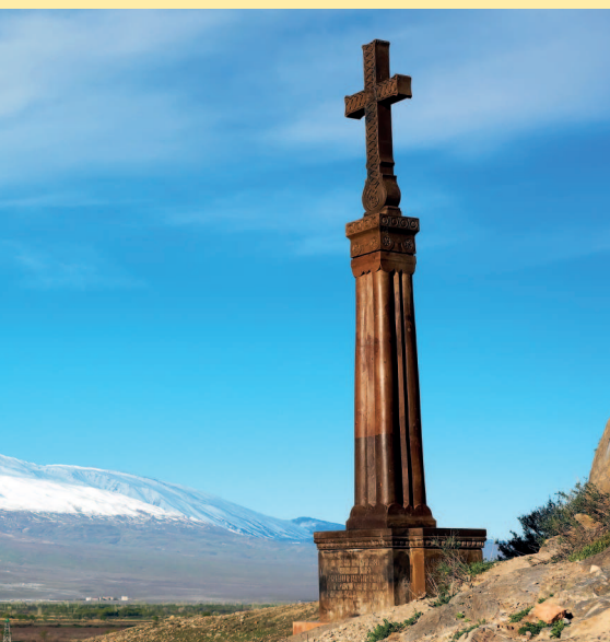
Христианский крест в древнем монастыре Хор Вирап недалеко от турецко-армянской границы.