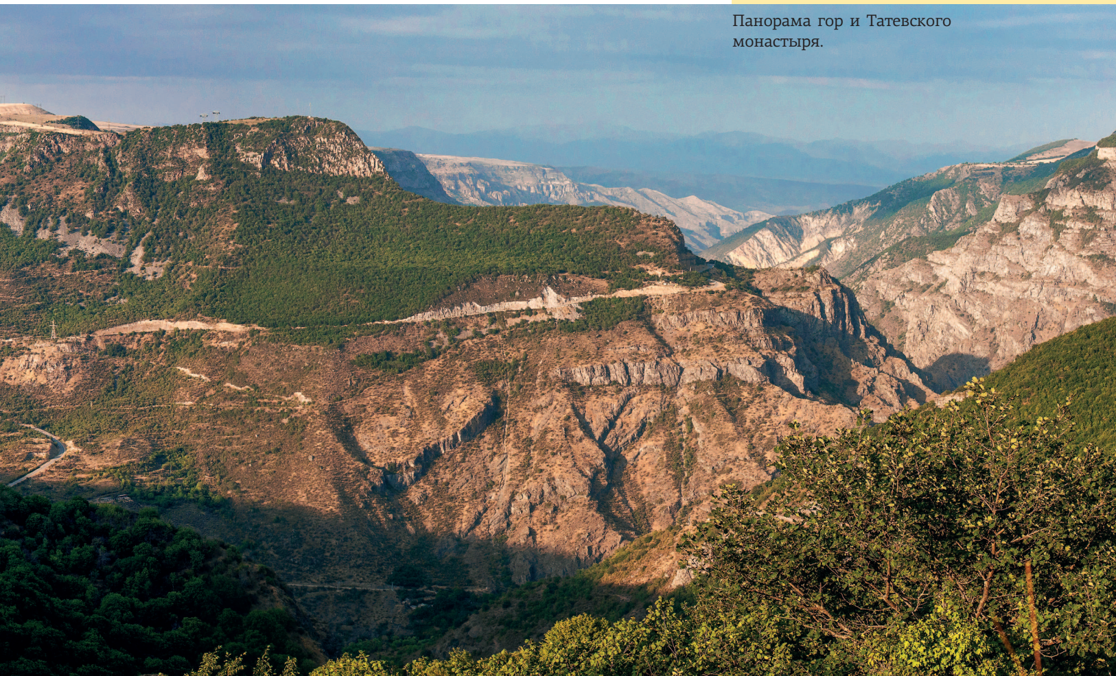
Панорама гор и Татевского монастыря.