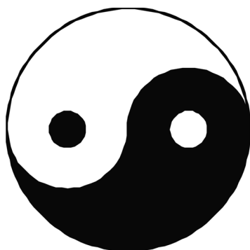
Схема Великого предела, символизирующего силы Инь и Ян

ра определяется соотношением Инь и Ян , то для диагностики и лечения болезней следует исходить из этого фундаментального положения».