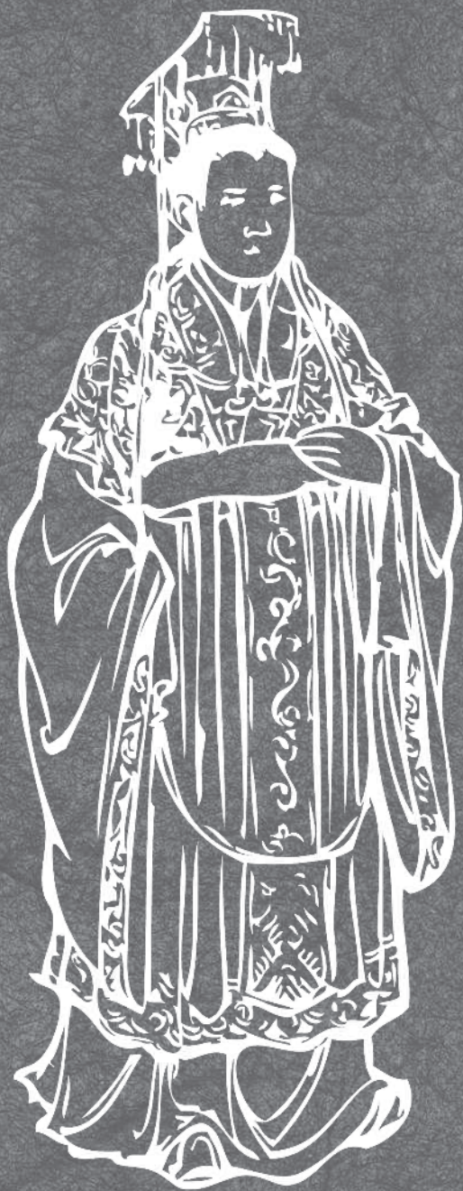
Сянь-ди — последний император династии Восточная Хань