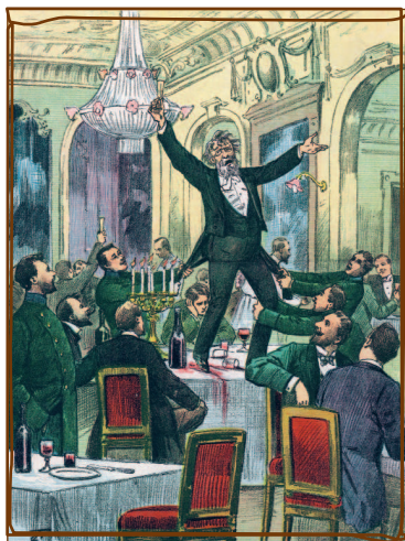
Татьянин день 1899 года.

Именитых гостей здесь было немало. А еще в этом роскошном ресторане можно было встретить... бедную молодежь. Правда, не всегда, а только на Татьяну, в день основания Московского Императорского университета. Этот праздник начинался торжественной частью в университете, затем продолжался весельем на улицах города и за пивом с водкой в трактирных заведениях средней руки. Так студенты готовили почву к самому важному акту этого дня — путешествию по фешенебельным ресторанам Москвы. Начиналось оно с «Эрмитажа»: «До 5 часов здесь сравнительно спокойно. Говорят речи, обедают. К пяти часам “Эрмитаж” теряет свою обычную физиономию. Из залы выносятся растения, все что есть дорогого, ценного, все, что только можно вынести. Фарфоровая посуда заменяется глиняной. Число студентов растет с каждой минутой. Сначала швейцары дают номерки от платья. Потом вешалок не хватает. В роскошную залу вваливается толпа в калошах, фуражках, в пальто. Исчезает вино и закуска. Появляется