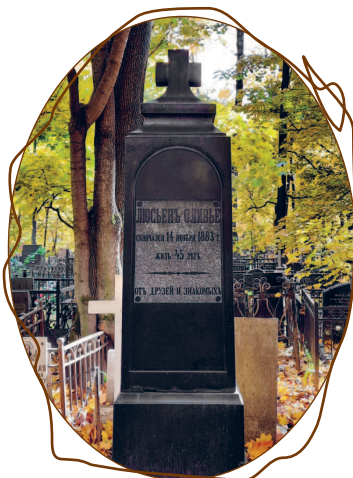
Могилы Люсьена Оливье.

14 ноября 1884 года Люсьен Оливье умер, похоронен он был на Введенском кладбище ( Наличная ул., 1 ). Сегодня к его могиле приходят все желающие найти работу в ресторанном бизнесе или достичь в этой сфере успеха. Ну а «Эрмитаж Оливье» оставался популярным и после смерти ресторатора. Несколько раз он перестраивался, менял фасад, приобрел общие залы для гостей, отдельные кабинеты и симпатичный летний сад. И в очередной раз подтвердил звание образцового учреждения, «которым Москва может и должна гордиться». Все так и было, даже столик свободный тут порой найти было сложно. Но только не почетным гостям. Любил это заведение актер Михаил Провович Садовский. Летом он ежедневно приезжал