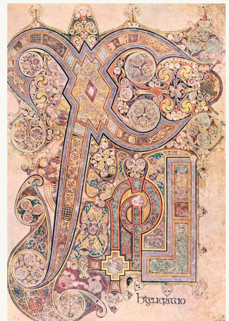
■ Лист 291 «Келльской книги», содержащий портрет Иоанна Евангелиста. Библиотека Тринити-колледжа, Дублин

То есть не было еще ни рыцарей, ни замков. Но трудолюбивые монахи уже создавали такие прекрасные произведения книжного искусства, что они и сегодня поражают наше воображение.