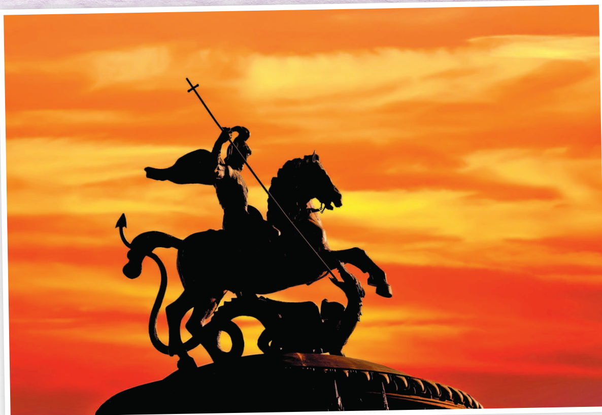
Памятник Святому Георгию на фоне заката

и несчастная стала ждать своей ужасной участи и горько плакать.