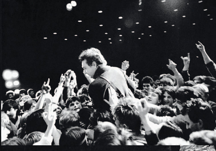
◀ Костя Кинчев в море поклонников. Ленинградский Дворец молодежи. 1987.