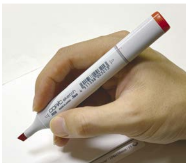
Маркер на спиртовой основе (Copic)