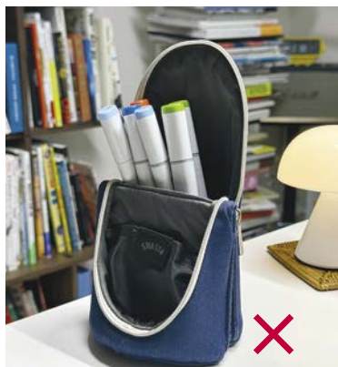
Неправильный способ хранения

Ниже указаны цвета, используемые в скетчах из этой книги. Хотя их всего двенадцать, с их помощью вы сможете добиться богатого спектра оттенков. Изучите характеристики каждого цвета и учитывайте их при дальнейшей работе.