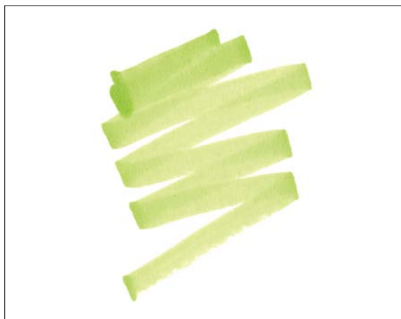
Примеры мазков толстым кончиком

Маркеры Sharpie, которыми я создавал скетчи для этой книги, в основном двусторонние. Посмотрите на примеры выкраски ниже: один выполнен толстым кончиком, а другой — тонким. Это удобно, потому что одним концом можно окрашивать большие фрагменты, а вторым — прорисовывать более мелкие детали. Когда работаете широким концом, держите маркер под наклоном, а при работе тонким — более вертикально.