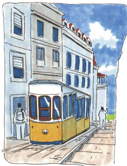
Неделя 4 — зарисовки в путешествиях