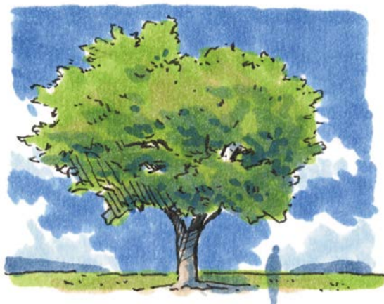
Неделя 1 — природа

В этой книге четыре раздела. Вы пройдете путь от рисования отдельных объектов до создания сложных пейзажей.