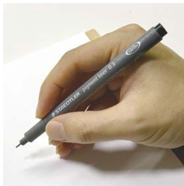
Линер (Staedtler Pigment Liner 0.3)

Вам понадобятся только линер, маркеры 12 цветов и бумага. Вы удивитесь, насколько разнообразные и красочные изображения вы сможете создать с помощью этого небольшого набора.