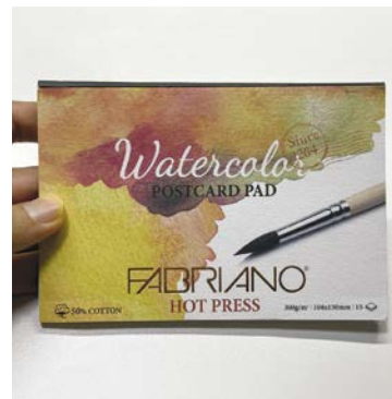
Бумара (Fabriano Bristol 300 г/м 2 )

Я рисую линером Pigment Liner от Staedtler, поскольку чернил в нем хватает надолго, а линии получаются оптимальной толщины. Кроме того, он устойчив к воздействию воды, поэтому после покраса иллюстрации маркерами на водной основе контуры остаются четкими и не расплываются. Подобные линеры есть у многих производителей, и важно найти тот инструмент, который будет удобен именно вам. Скетчи из этой книги выполнены при помощи Staedtler Pigment Liner 0.3.