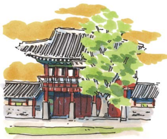
Неделя 2 — здания