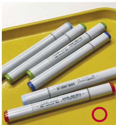
Правильный способ хранения

Не рекомендую рисовать маркерами в самолете. Из-за перепада давления на рисунок может попасть больше чернил, чем нужно, или же маркеры могут вовсе протечь. Если вам все же приходится использовать их во время полета, выбирайте маркеры на водной основе.