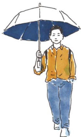
Неделя 3 — человек