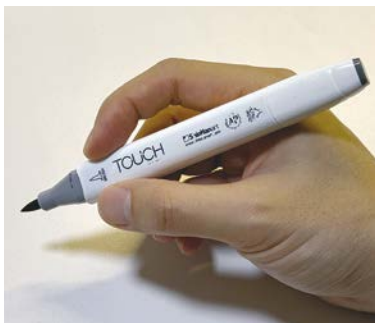
Маркер Touch Twin ShinHan Art

Из корейских маркеров с хорошими базовыми цветами я могу посоветовать маркеры Shinhan Art: их линейка Touch Twin получила отличные отзывы. Моя личная рекомендация — маркеры Copic, которыми и выполнены скетчи в этой книге. Хочу вас предупредить, что у некоторых маркеров на спиртовой основе очень стойкий запах спирта и при долгой работе с ними у вас может закружиться голова: в таких случаях рисуйте в хорошо проветриваемом помещении.