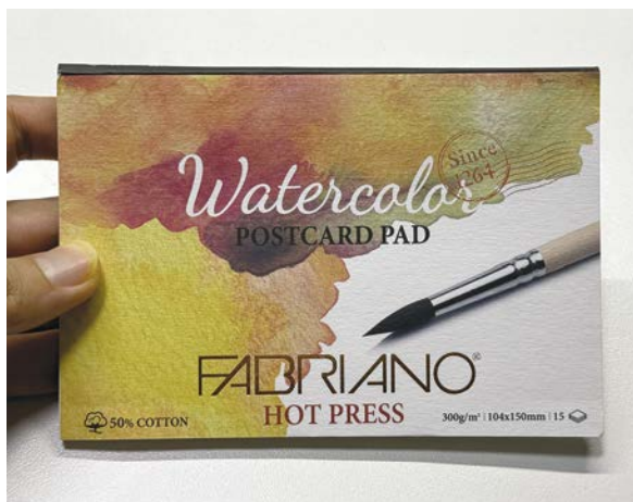
Бумага Fabriano Bristol Hotpress 300 г/м 2 (50 % хлопок)

Да, подойдет любая бумага, но выберите не слишком тонкую, иначе рисунок отпечатается через нее. Выберите плотные и гладкие листы, тогда при покрасе не возникнет проблем.