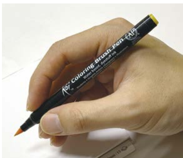
Маркер на водной основе (Sakura koi)

Любая живописная и графическая работа со временем тускнеет и выцветает. Чтобы это предотвратить, рисунки часто покрывают лаком, но учтите, что его нужно выбирать с умом. Для работ, покрашенных спиртовыми маркерами, подходит лак на масляной основе, а для сделанных водными маркерами — лак на водной основе. Из-за разницы молекулярных структур неправильно выбранный лак может испортить работу, поэтому перед закреплением всегда проводите предварительную проверку.