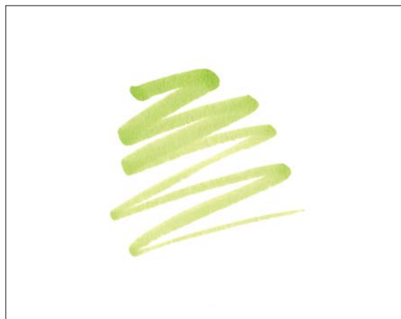
Примеры мазков тонким кончиком

Наносите цвет не круговыми движениями, а зигзагами, старайтесь не нажимать на маркер слишком сильно, чтобы контролировать, сколько чернил вытекает, и не поставить кляксы. Если цвет становится тусклым, проверьте, не закончились ли чернила, и заправьте маркер при необходимости.