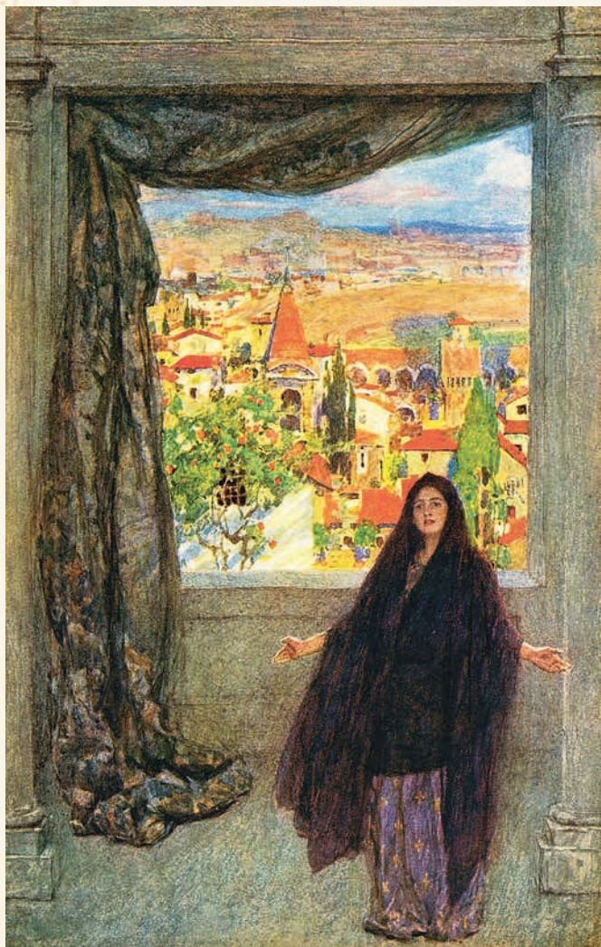
«В ВЕРОНЕ, ГДЕ ВСТРЕЧАЮТ НАС СОБЫТЯ...»