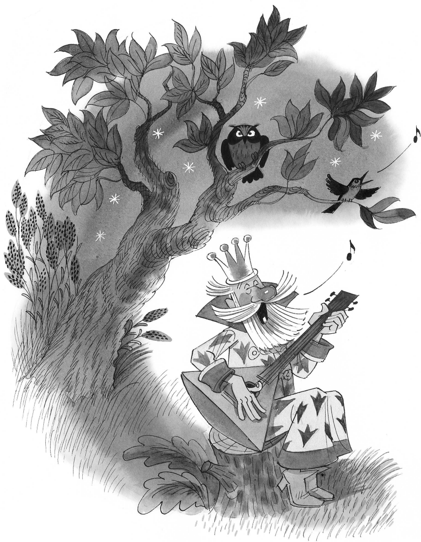
Художник Виктор Чижиков