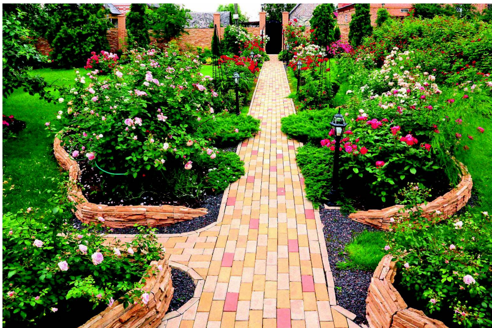
Поверхность почвы нужно закрывать мощением или мульчей