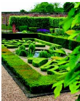
Симметричный формальный партер

Для небольшого участка в средней полосе России, пожалуй, наиболее предпочтителен сад с преобладанием элементов именно ландшафтного, свободного стиля.