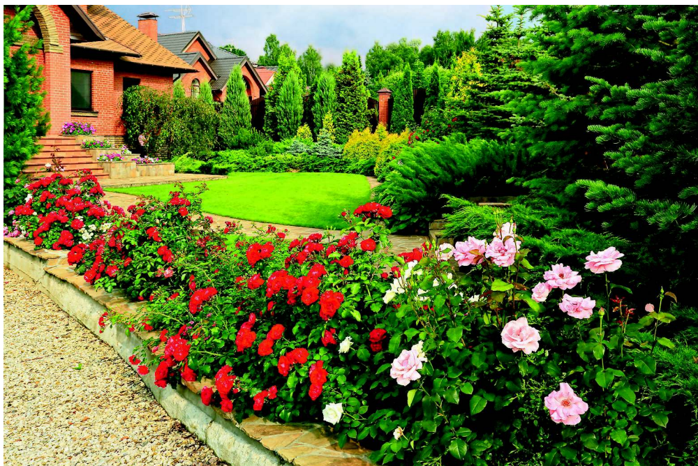
Кислые почвы благоприятны для выращивания хвойных и роз