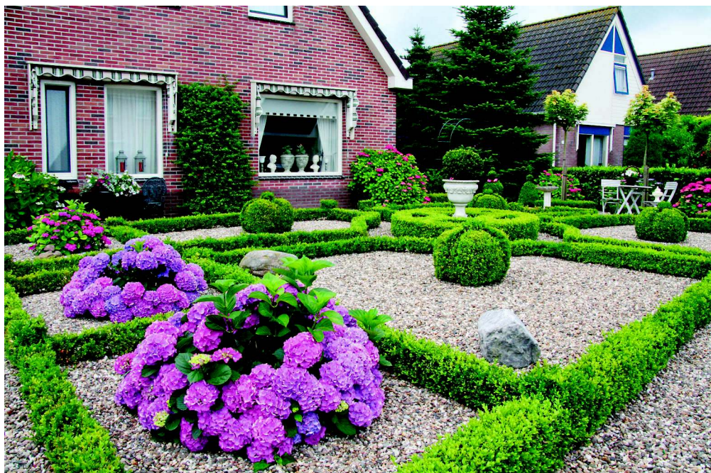
Входную зону участка можно оформить в регулярном стиле

сада, – своего рода проектное задание. При этом следует учитывать как реалии, так и всяческие вероятные грядущие события и обстоятельства, а именно: наличие в семье аллергиков и присутствие домашних животных, возможное прибавление семейства и частоту приема гостей, подрастание детей и внуков, выход домочадцев на пенсию и т. д.