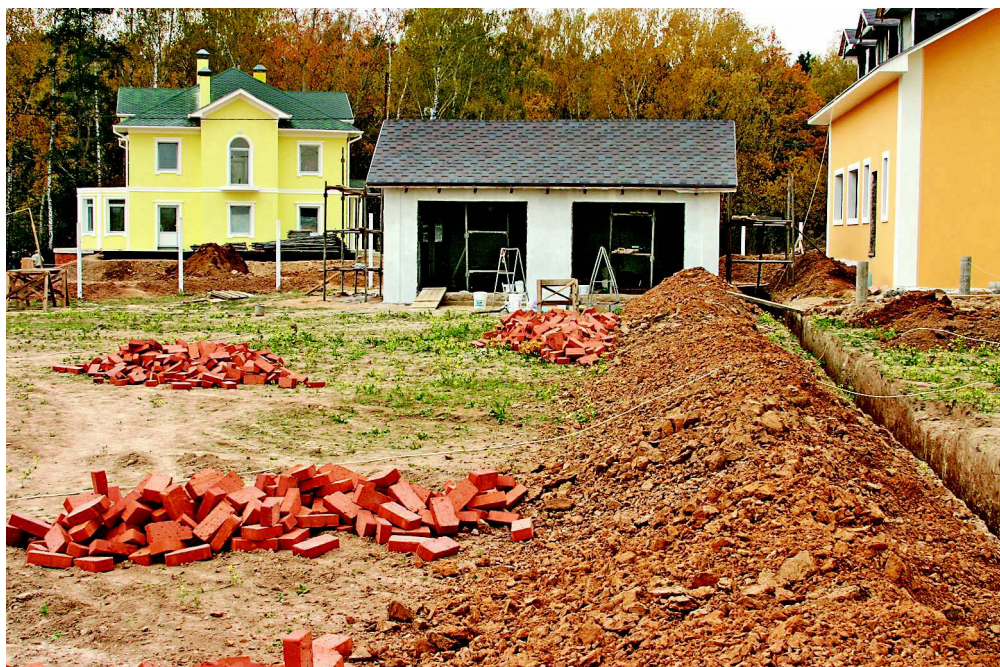
Благоустройство участка начинают с проекта сада

На плане отмечают стороны света, определенные по компасу, обозначают места входа и въезда на участок, наносят в масштабе все имеющиеся строения с указанием расположения дверей и окон, а также прочие объекты: канавы и холмы, водоемы и колодцы, вентиляционные короба и люки. Обозначают и по возможности выясняют глубину закладки канализационных, электрических, газовых и прочих коммуникаций. Обязательно помечают деревья и кустарники, которые желают сохранить, уточняя их вид, возраст и общее состояние.