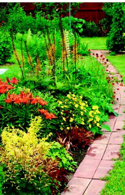
Под цветники почву готовят основательно

Проведение подробного анализа обстановки на участке, составление плана, тщательный учет всех требований и пожеланий к облику и содержанию будущего сада, определение его основной концепции составляют первый этап создания проекта.