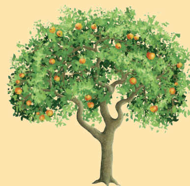
яблоня с яблоками

Мы выращиваем их по большей части ради сладких и вкусных фруктов, ягод и орехов, которые на них растут. Они также кормят и укрывают под своей сенью множество маленьких живых существ, например, насекомых и птиц.