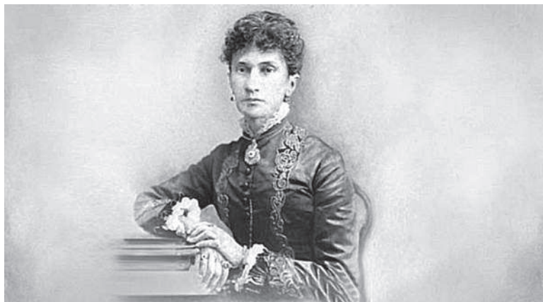
Надежда Филаретовна фон Мекк

Но тогда я твёрдо решила, что после такого «большого оперного» Чайковского в театр больше не пойду. Никогда! Вообще! И оперу не буду слушать. Только симфоническую