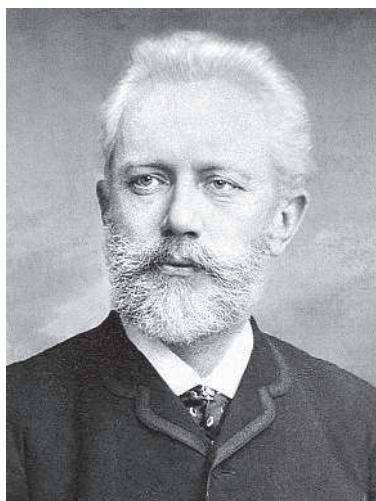
Петр Ильич Чайковский

А Чайковский? Мне кажется, что он чувствовал не то, чтобы за всех нас, но, без сомнения, гораздо глубже и острее, чем все мы. Он умел зацепить такие душевные струны, ощутить такое «дольней лозы прозябанье», такую мировую скорбь, какие не дано было расслышать никому из его современников. При этом ему, в силу его человеческой природы — я имею право так говорить, перелопатив все романы Чайковского, вообще всю его камерную лирику, — были вняты движения, терзания и «ломки» как мужской, так и женской души.