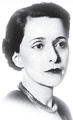
Нина Николаевна Берберова