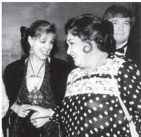
Любовь Казарновская и Ирина Архипова