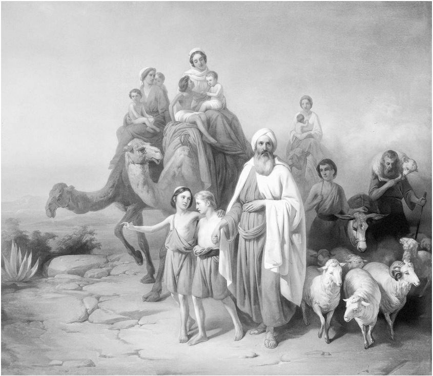
■ Йозеф Молнар. Переселение Авраама. 1850

и строительство. Здесь впервые появилась письменность и возникли первые государства... И здесь был построен Иерусалим, в горных пещерах которого сияют тысячи солнц, как поется в песне 1 .