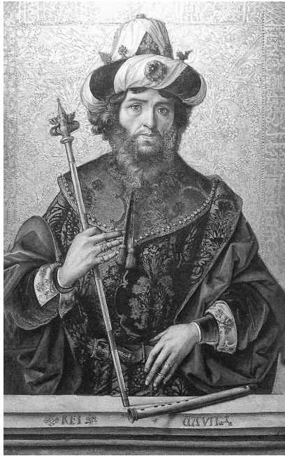
■ Педро Берругете. Царь Давид. XV век

рый взял себе наложницу из Вифлеема. Однажды они поссорились, и наложница вернулась к своему отцу. Левиту пришлось идти за ней в Вифлеем, где тесть его оказал ему теплый прием. «И встал тот человек, чтоб идти, сам он, наложница его и слуга его. И сказал ему тесть его, отец молодой женщины: вот, день преклонился к вечеру, ночуйте, пожалуйста; вот, дню скоро конец, ночуй здесь, пусть повеселится сердце твое; завтра пораньше встанете в путь ваш, и пойдешь в дом твой. Но муж не согласился ночевать, встал и пошел; и пришел к Иевусу, что ныне Иерусалим; с ним пара навьюченных ослов и наложница его с ним».