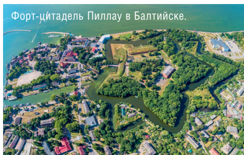
Форт-цитадель Пиллау в Балтийске.

На территории региона есть морское побережье с пляжами, дюнами и целебными источниками, есть озера и реки с чистой водой и рыбным изобилием, есть целая сеть архитектурных и исторических памятников довоенного времени — замков, крепостей, церковных и жилых сооружений, построенных в готическом духе. Наконец, в области расположены десятки городов, небольших, но очень живописных, в которых сохранилась историческая атмосфера, они порадуют туристов старинной застройкой и современной инфраструктурой. Самая яркая звезда на территории области — это ее столица, город Калининград. Давайте с него и начнем наше увлекательное знакомство с самым западным регионом России — Калининградской областью.