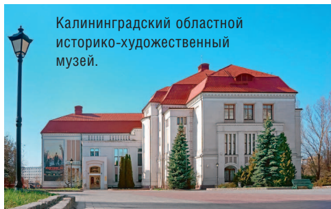
Калининградский областной историко-художественный музей.

Археологический зал рассказывает о ранних временах заселения края и жизни балтских племен. Зал истории освещает период от завоевания Пруссии тевтонцами. Здесь можно увидеть образцы орудий, мебели, предметов быта горожан. Есть отдельный Зал войны, он посвящен жизни города в годы Второй мировой войны и Восточно-прусской военной операции 1944–1945 годов. Проникнуться этими историческими событиями поможет трехмерная панорама «Кёнигсберг-45. Последний штурм», а также документы, фотографии, личные