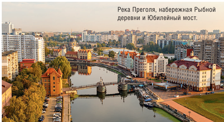
Река Преголя, набережная Рыбной деревни и Юбилейный мост.

библиотека», двадцать томов истории, теологии, дипломатии в тяжелых серебряных окладах с золочением. Более того, именно здесь частично располагалась легендарная Янтарная комната, вокруг которой до сих пор ходит много легенд и тайн. Здесь неоднократно проходили коронации герцогов, а в 1861-м замок стал местом коронавания первого императора Германии Вильгельма I. После окончания Первой мировой войны в Королевском замке Кёнигсберг разместился музей «Пруссия». Основные разрушения замка произошли в ходе боевых действий 1944–1945 годов после английских авианалетов. Затем из развалин замка брали кирпич, и в 1952-м обвалилась главная башня, после чего руины в целях безопасности решено было окончательно взорвать. В результате сейчас остались несколько руинированных фрагментов стен, которые законсервированы до лучших времен. Символично, что на месте замка в 1970-е начали возводить «Дом Советов», но этот объект, ввиду