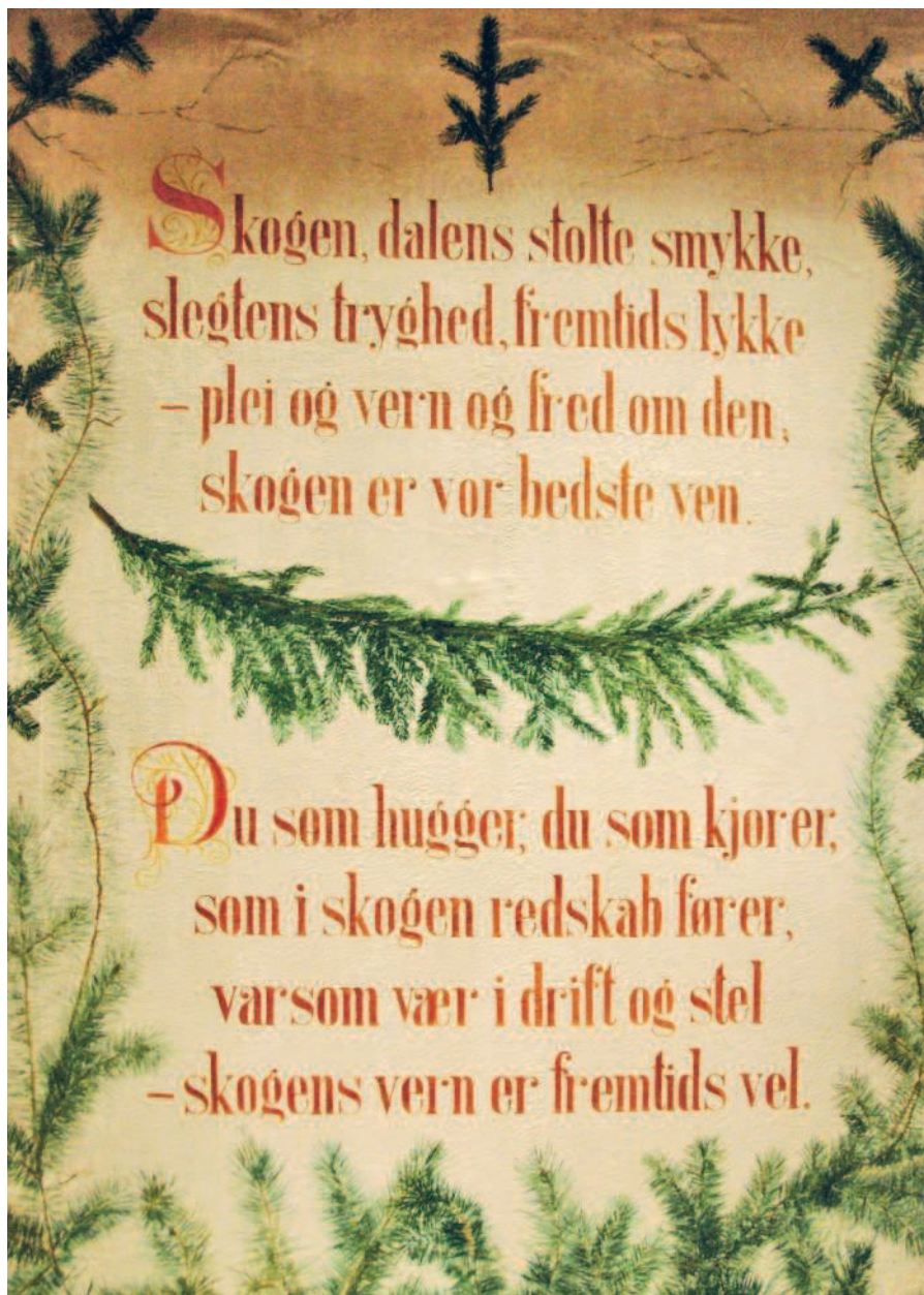
Каллиграфический плакат на холсте, скорее всего, изготовлен Норвежским лесным сообществом к юбилейному концерту в Кристиании в 1914 году. Автор неизвестен