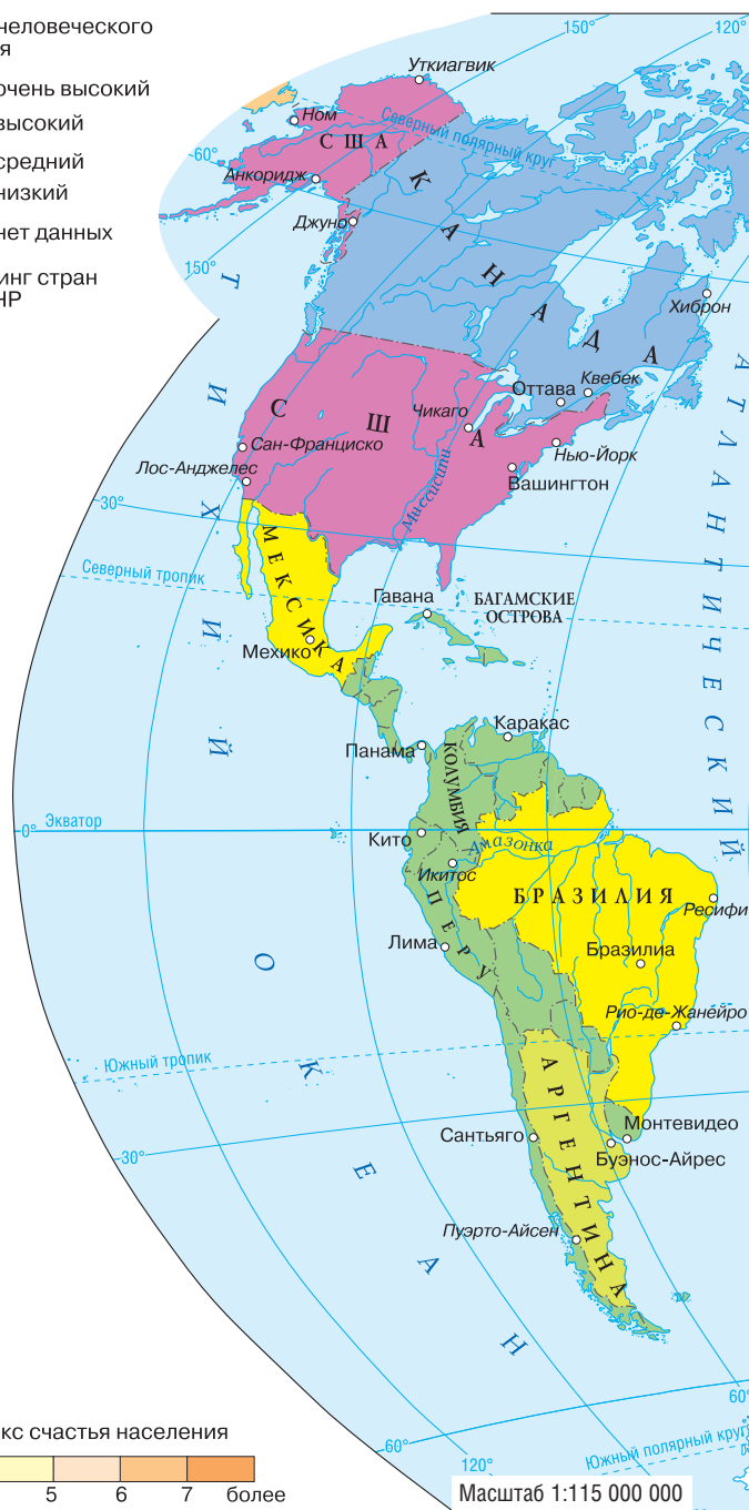
Масштаб 1:115 000 000