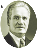
Н.Н. Баранский (1881–1963) советский учёный-географ

Географически мыслит тот, кто в достаточной мере привык обращать внимание на различия от места к месту не только по природным условиям, но и по историческим судьбам, и по общественно-политическим условиям, и по положению, и по хозяйству, кто привык свои суждения «класть на карту», кто привык ставить вопрос о причинах, обуславливающих различия от места к месту, кто привык связывать эти различия между собой, составлять цельные представления о местности, давать связные характеристики стран и районов.