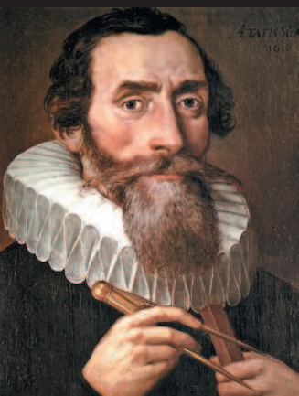
◀ Иоганн Кеплер

Сочетания этих трех качеств самоцветов люди начали исследовать очень давно. Технология обработки драгоценных камней развивалась столетиями и достигла современных высот только к началу XX в. Сложность обработки самоцветов обусловлена их твердостью, а также множеством законов физики и кристаллографии, которые необходимо учитывать при огранке камня. И если физика как наука возникла благодаря древнегреческому ученому-философу Аристотелю уже в IV в. до н.э., то кристаллография — это относительно молодая область знаний.