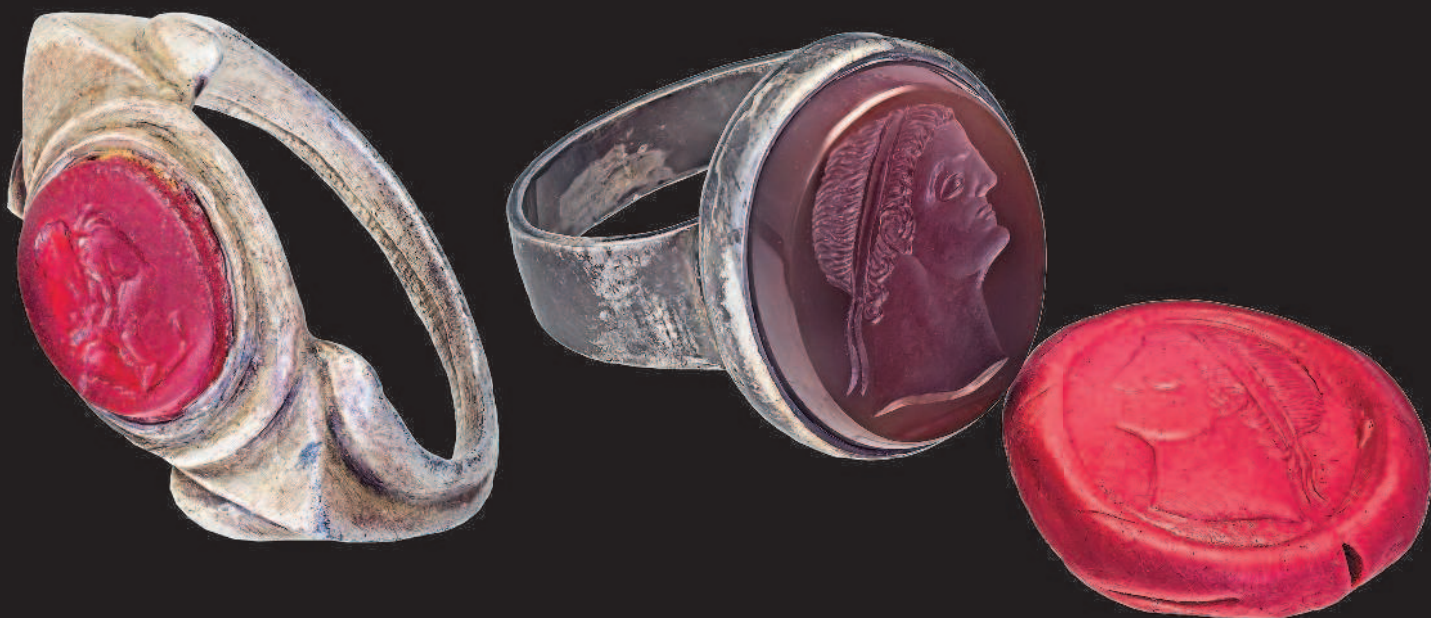
▲ Кольцо с инталией в римском стиле. Серебро. Сердолик