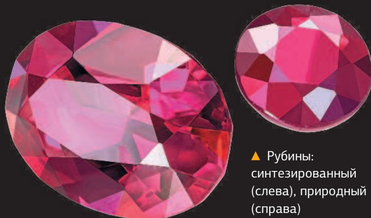
▲ Рубины: синтезированный (слева), природный (справа)

На рубеже XIX—XX вв. появляется технология, позволяющая изготавливать синтетические рубины, практически не отличимые по химическому составу и физическим характеристикам от природных камней. В XX в. исследования продолжаются, и вот уже человечество в состоянии синтезировать в лаборатории большинство драгоценных камней: сапфиры, alexandrites, изумруды и кварцы (аметисты и цитрины). Себестоимость производства синтетических самоцветов очень низкая, что позволяет использовать уникальные свойства этих камней в областях, далеких от ювелирного искусства. Например, синтетический рубин послужил основным элементом для самого первого в мире лазера. В середине XX в. появились первые искусственно синтезированные алмазы.