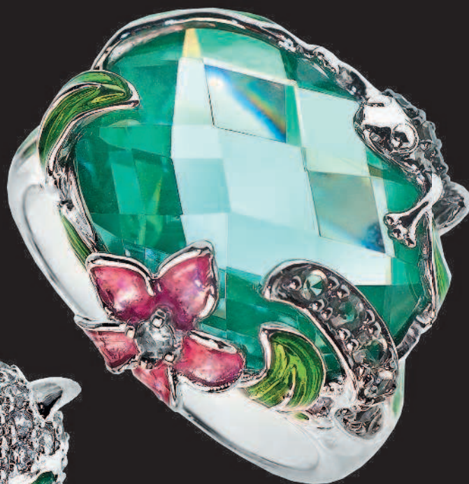
▲ Кольцо с синтетической зеленой шпинелью

К концу XX — началу XXI в. люди уже знали и использовали столько ювелирных цветных камней, сколько не было известно за все 10 000 лет истории человечества.