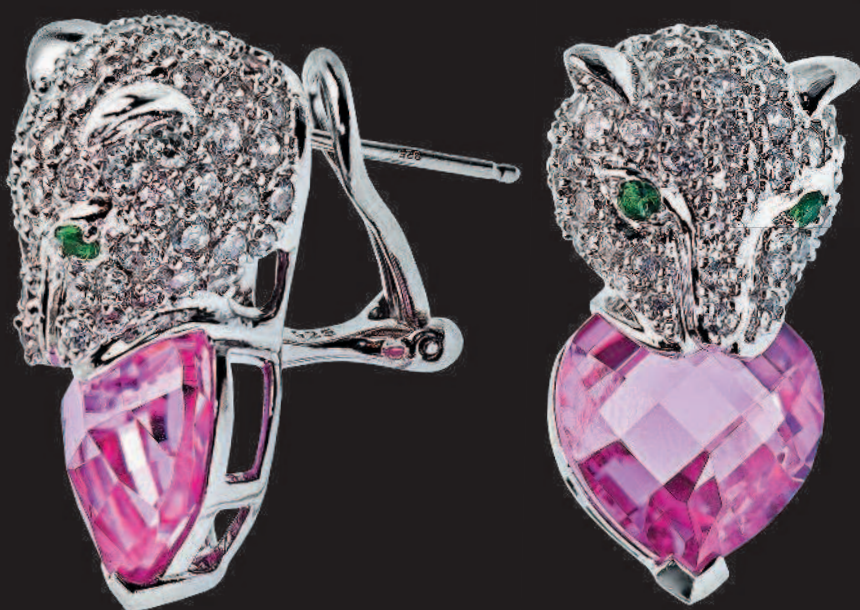
◀ Серьги с синтетическими розовыми корундами