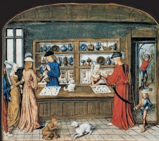
▲ Ювелирный магазин. Франция. Миниатюра XV в.

Кроме того, мир современных драгоценных самоцветов, и мир тех камней, которые считались драгоценными в давно минувшие дни, разительно отличаются. Даже названия старинных самоцветов никак не пересекаются с сегодняшними наименованиями. Вряд ли наш современник без специального образования сможет объяснить разницу между, скажем, драгоценным карбункулом, яхонтом, лалом и венисой. Старинные названия камней, прошедшие сквозь века, в наше время полностью поменяли смысл. Например, тот самоцвет, который четыре тысячи лет назад называли сапфиром, сейчас стал ляпис-лазурью или лазуритом. Изумрудом или смарагдом считали, скорее всего, современный хризолит.