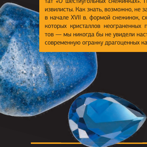
◀ Два камня, в разное время называвшиеся сапфиром: ляпис-лазурит (слева) и сапфир (синий корунд) (справа)

В основе кристаллографии лежит работа немецкого астронома и математика И. Кеплера, изданная в 1611 г. — трактат «О шестиугольных снежинках». Пути истории крайне извилисты. Как знать, возможно, не заинтересулся Кеплер в начале XVII в. формой снежинок, сходной с формой некоторых кристаллов неограниченных природных самоцветов — мы никогда бы не увидели настолько совершенную современную огранку драгоценных камней.