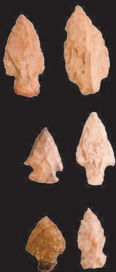
▲ Каменные наконечники стрел

Цветные камни всегда представляли ценность для людей. Правда, это не всегда были ювелирные самоцветы и понимание их ценности в разные времена выглядело совершенно по-разному.