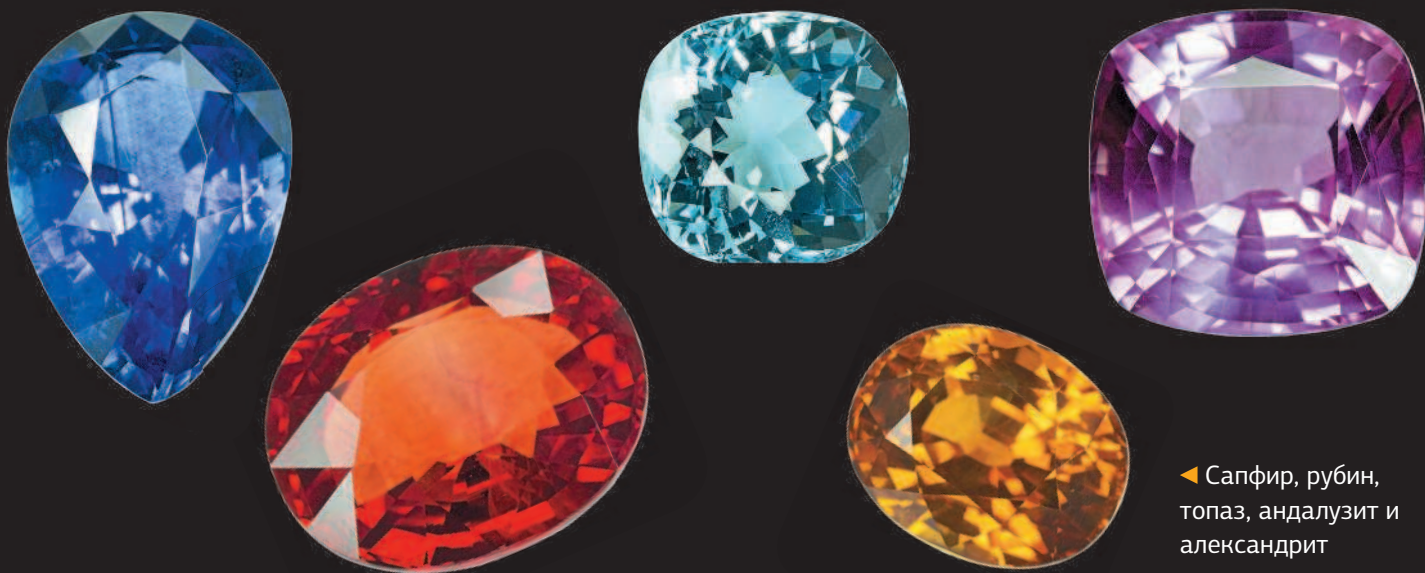
◀ Сапфир, рубин, топаз, андалузит и александрит

Ближе к XVI в. самой ценной ювелирной драгоценностью стал жемчуг. Индийские жемчужины, добываемые в Персидском заливе, служили для демонстрации богат-