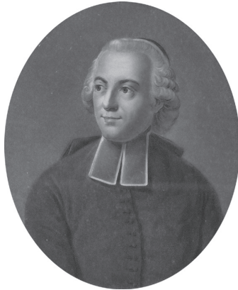
Этьен Бонно де Кондильяк. Конец XVII – начало XIX в.