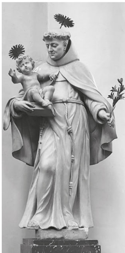
Статуя св. Антония