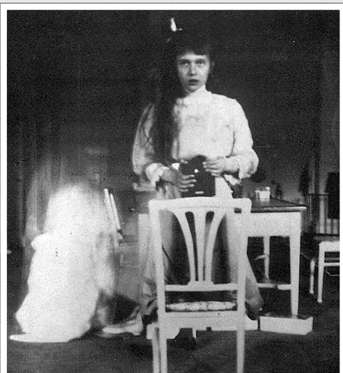
13-летняя великая княжна Анастасия Николаевна, дочь последнего императора России, фотографирует свое отражение в зеркале. Фото сделано в 1914 году на камеру Kodak Brownie. Возможно, этот снимок является первым русским селфи