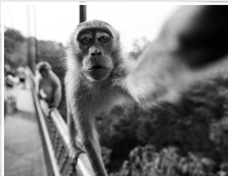
Даже обезьяны могут делать селфи. Автопортрет макаки