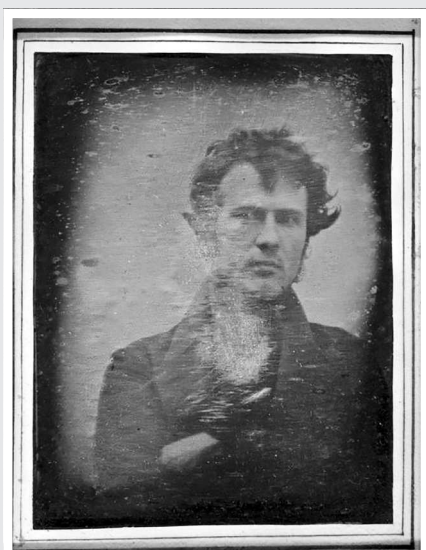
Первое в мире селфи было сделано американским пионером фотографии Робертом Корнелиусом в 1839 году