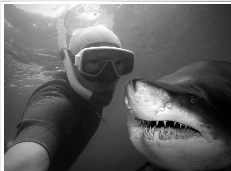
Люди готовы пойти на многое, чтобы получить удачный кадр. Стоит быть осторожными: в мире уже произошли десятки трагедий, связанных с потерей бдительности ради создания впечатляющих фото