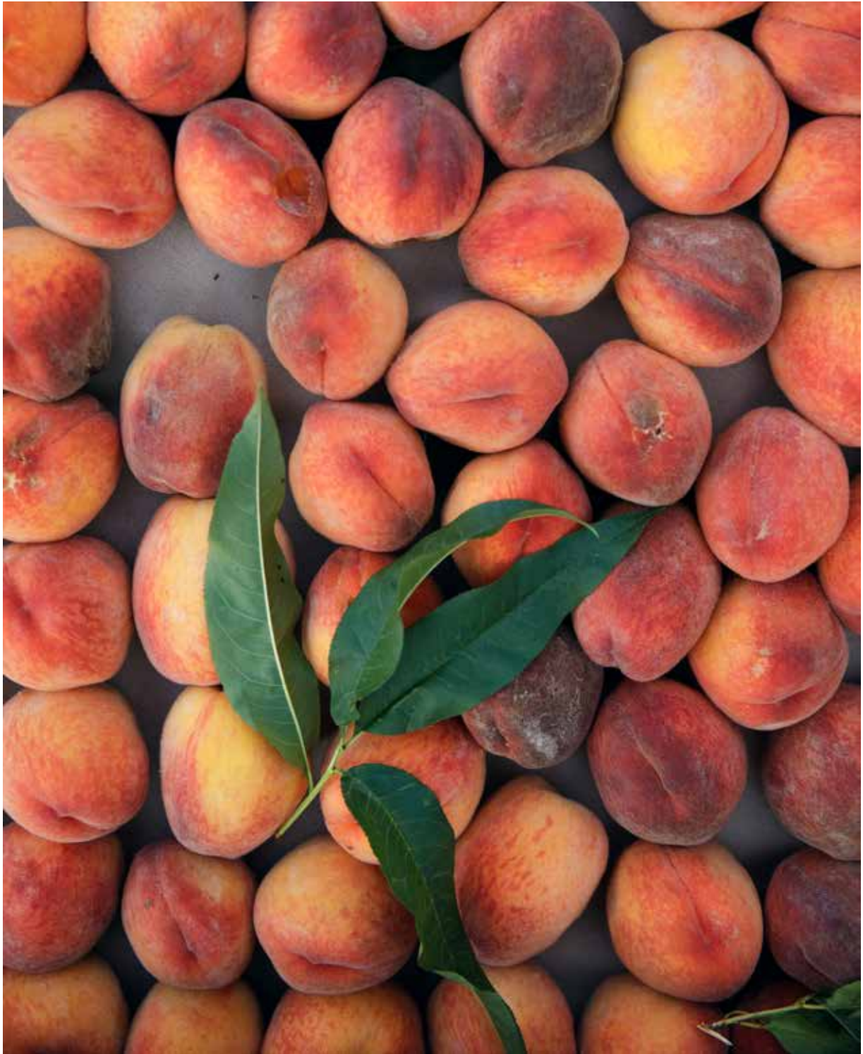
Ароматные горные персики