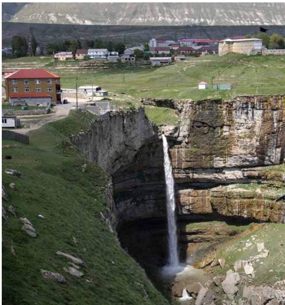
Водопад Тобот в Хунзахе

Хунзах – родное село Хаджи-Мурата, исторического деятеля и персонажа одноименной повести Льва Толстого. Великий русский писатель бывал в Дагестане, что его вдохновило в том числе на написание «Набега», «Рубки леса», «Кавказского пленника».