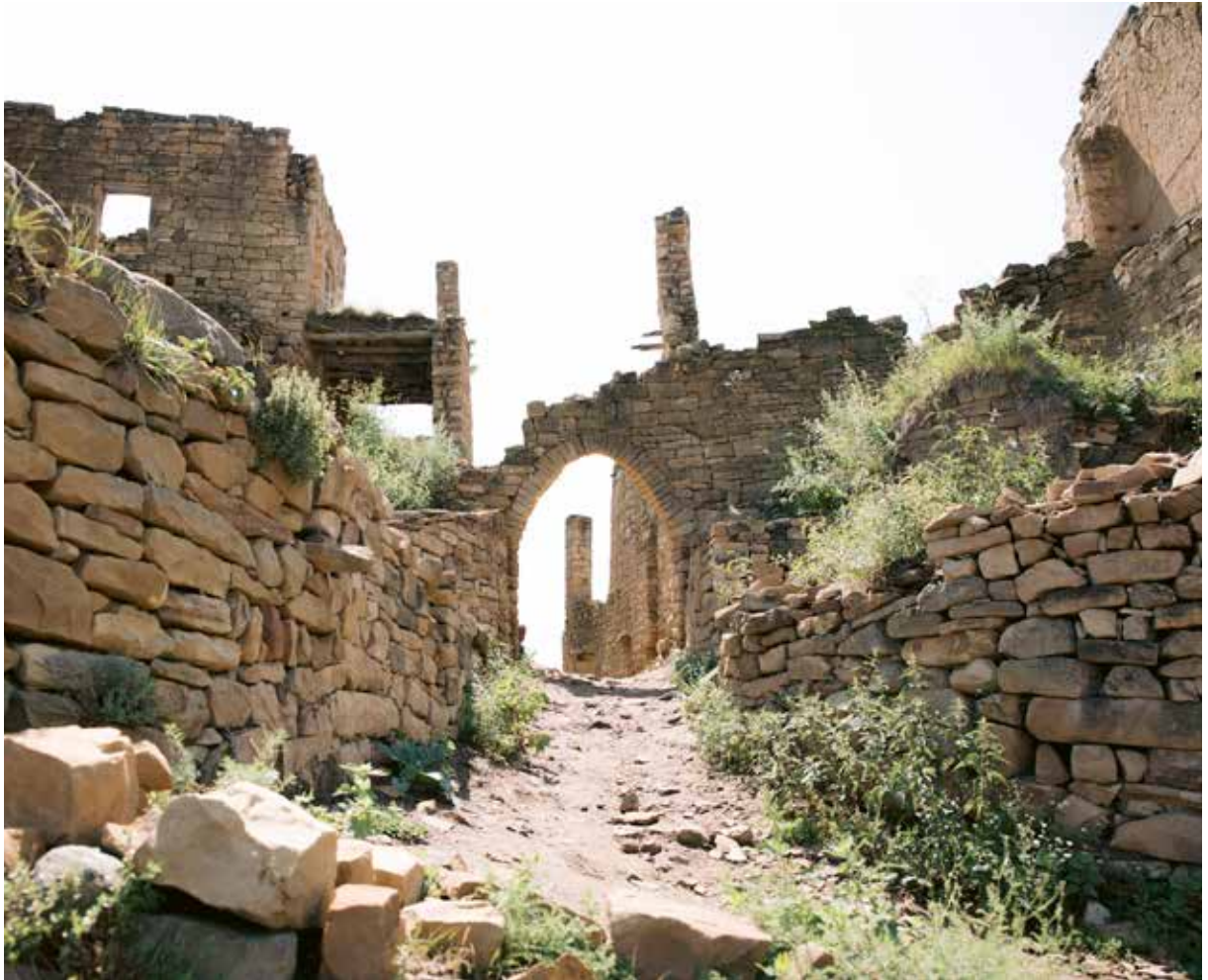
Арка в Гамсутле

При возведении дома традиционно ориентировали его лицевую часть на юго-восток. Так удавалось получать больше солнечного света, до дома доходило меньше холода, идущего с севера и запада. Пользовались популярностью двухэтажные постройки: на первом этаже располагался хлев для животных, а на втором — жилые помещения. Таким образом, животные на первом этаже свои теплом отапливали второй этаж, а тем, что строили сразу два этажа, сэкономили ценную землю.