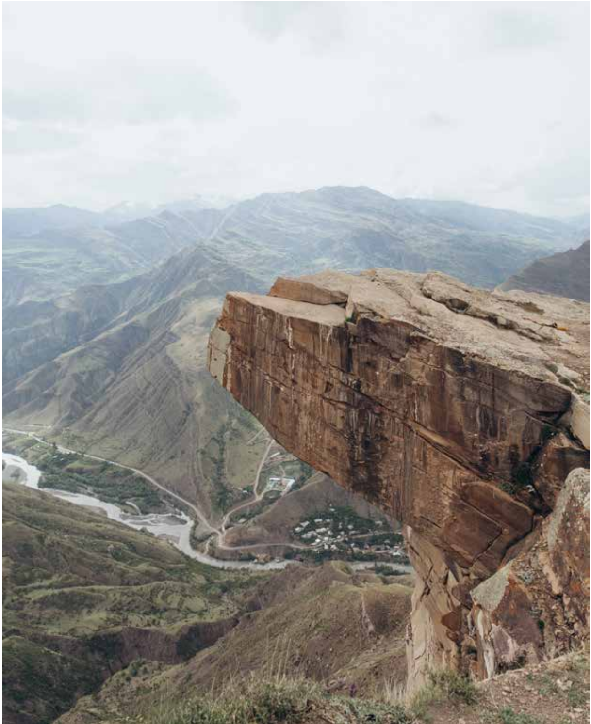
Язык тролля рядом со Старым Гоором