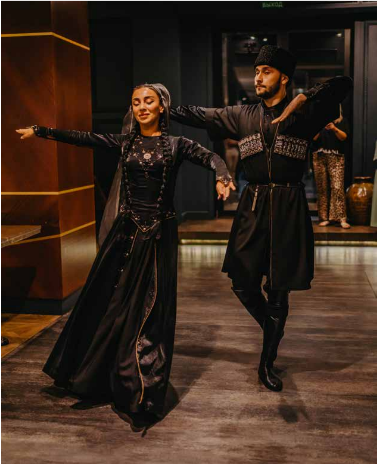
Зажигательный танец в одном из ресторанов Махачкалы