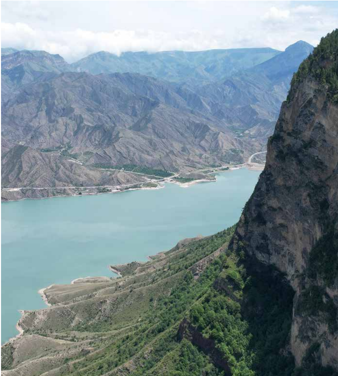
Ирганайское водохранилище недалеко от смотровой рядом с селом Харачи