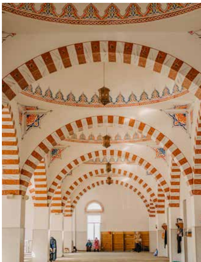
Арки Джума-мечети в Махачкале