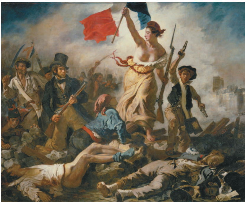
Эжен Делакруа. Свобода, ведущая народ. 1830 г.

Знаменитый шедевр «Свобода, ведущая народ» художник Эжен Делакруа создал во время сражений в революционном Париже. Восставших ведет к победе аллегорическая фигура античной богини, вздымающей знамя Республики. Написанное в стиле романтизма живыми динамичными мазками, полотно символизирует единство французского народа и напоминает о неизбежности жертв во имя величайшего достояния человечества.