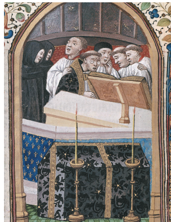
Неизвестный мастер. Часослов. Миниатюра. Около 1450 г.