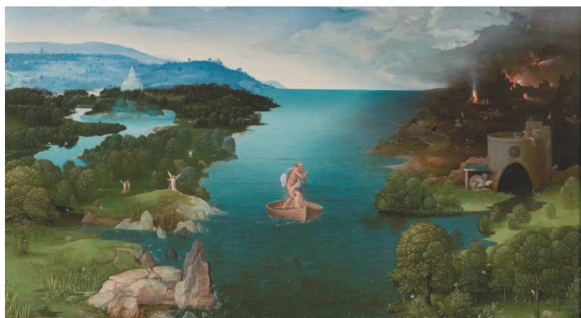
Иоахим Патинир. Переправа через Стикс. Около 1520–1524 гг.

Стремление передать единение природы и человека привело к включению в пейзажи фигурок. Такие детали изображения называют стаффажем. Они позволяют оценить масштаб творений природы и по виду героев, мирно пасущимся или сражающимся группам животных точнее понять основную мысль. В эпоху Возрождения одним из первых этот прием стал использовать фламандец Иоахим Патинир.