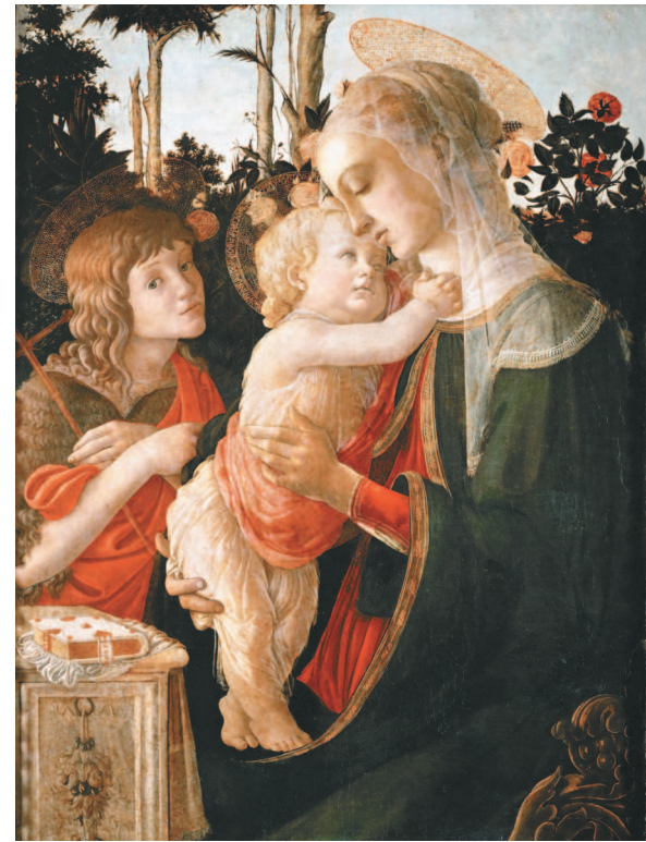
Сандро Боттичелли. Мадонна с Младенцем и юным Иоанном Крестителем. Около 1470–1475 гг.

Первыми исполнителями христианских песнопений были монахи. Сборники музыкальных произведений для них украшали изящные миниатюры. Религиозные песнопения составляют золотой фонд шедевров музыкального искусства. Знаменитая «Аве Мария» Франца Шуберта или трагический «Реквием» Вольфганга Амадея Моцарта заставляют замирать сердца многих поколений слушателей.