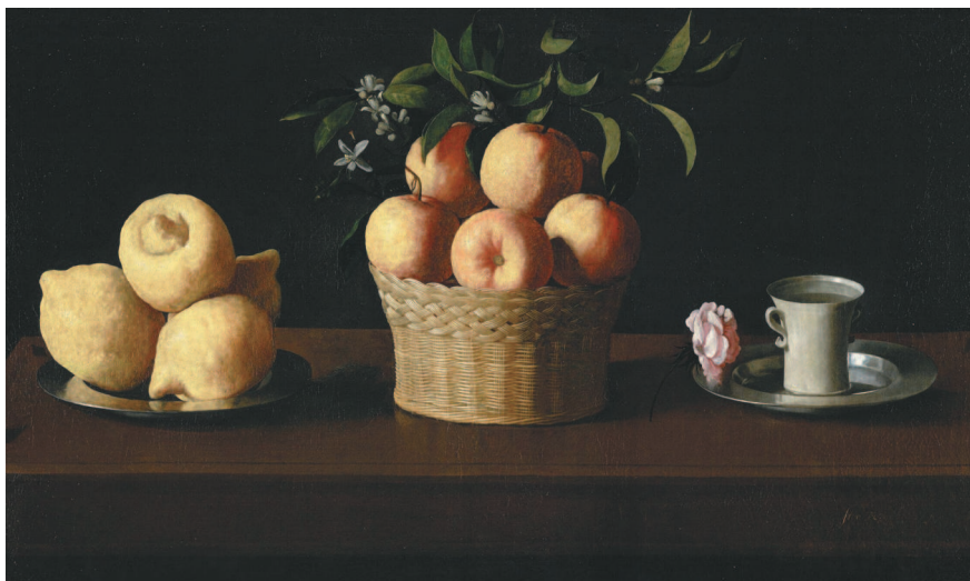
Франсиско де Сурбаран. Натюрморт с лимонами, апельсинами и розой. 1633 г.

Мастера натюрморта не ограничивались любованием красотой земных плодов. Яркий цвет фруктов, блеск посуды доставляют глазу истинное удовольствие, однако за простыми предметами скрыт глубокий смысл. Свежие краски картины Франсиско де Сурбарана почти ощутимо передают бугристую грубость и горьковатый аромат лимонов, нежность цветков и плодов апельсина и бархатистость лепестков розы на сияющей чистой тарелке. Но главным для живописца и его современников был скрытый в этих предметах и их сочетании образ Троицы и напоминание о Деве Марии.