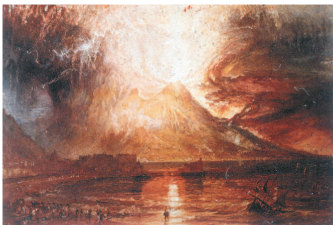
Уильям Тернер. Извержение Везувия. Около 1817 г.

Восхищение могуществом природы нашло отражение в пейзажах. Вспышки света и мрачная тяжесть туч, зеркальные отблески вод и громады высящихся над ними гор передают впечатление от созерцания буйства стихии. Такова акварель Тернера, запечатлевшая извержение Везувия. Художник вместил на небольшой лист детали, которые усилили грандиозность события.