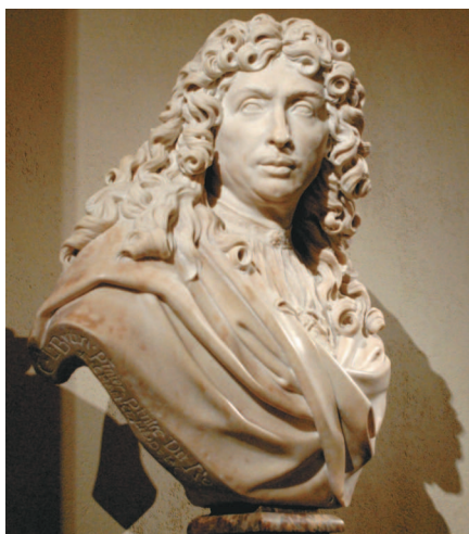
Антуан Куазевокс. Бюст Шарля Лебрена, первого художника короля. 1679 г.