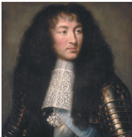
Шарль Лебрен. Портрет Луи XIV, короля Франции. Около 1662 г.