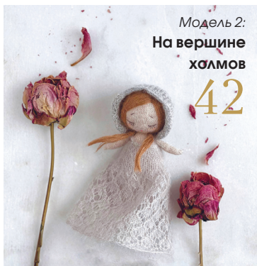
Модель 2: На вершине холмов 42