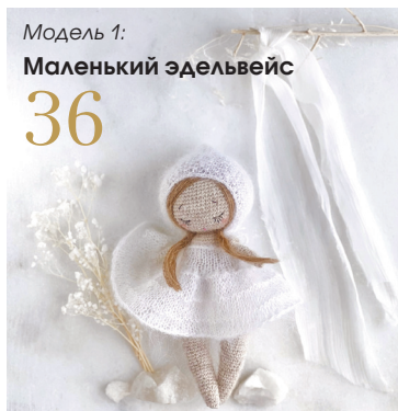
Модель 1: Маленький эдельвейс 36