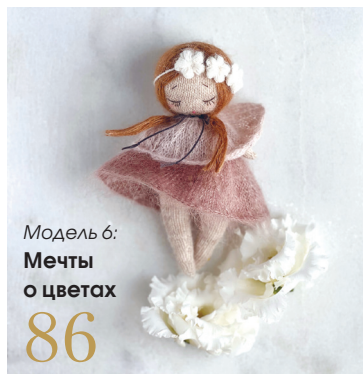
Модель 6: Мечты о цветах 86