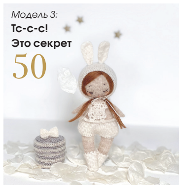
Модель 3: Тс-с-с! Это секрет 50