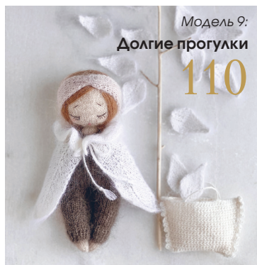
Модель 9: Долгие прогулки 110