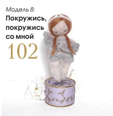
Модель 8: Покружись, покружись со мной 102