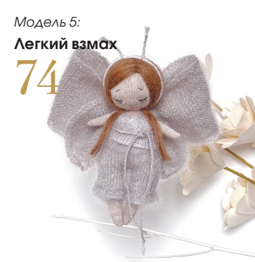
Модель 5: Легкий взмах 74