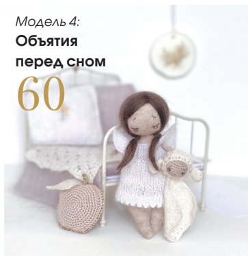
Модель 4: Объятия перед сном 60