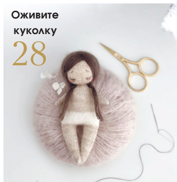
Оживите куколку 28