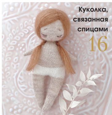
Куколка, связанная спицами 16