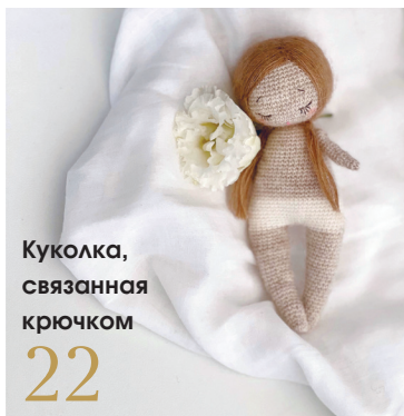
Куколка, связанная крючком 22