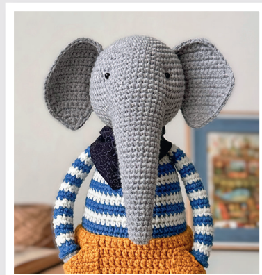
СЛОН СЭМ 109