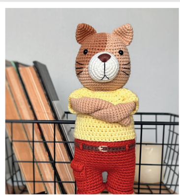
КОТ АЛЕКС 93