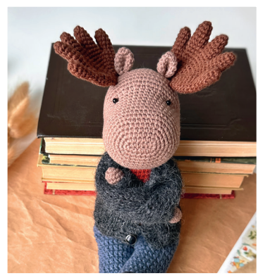
ЛОСЬ ФРЭНК 51