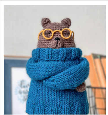
МЕДВЕДЬ БРЗДЛИ 79