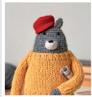
ВОЛК НИК 67