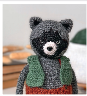
ЕНОТ ДЖЕЙМС 125