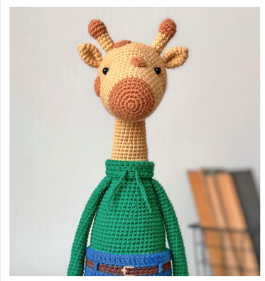
ЖИРАФ ДЖЕРАЛЬД 31