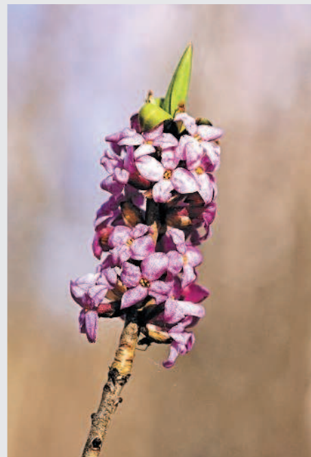
Волчье лыко, цветы

В кустарник входит и любое молодое деревце, когда оно ещё маленькое, будь то берёза, ольха, осина, маленькая сосенка или пушистая ёлочка. Но они-то, деревья, вырастут, станут большими, раскинут в вышине свои мощные ветви. А кустарник так и останется внизу.