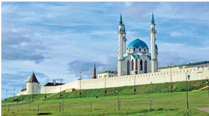
Казанский кремль — объект Всемирного наследия ЮНЕСКО