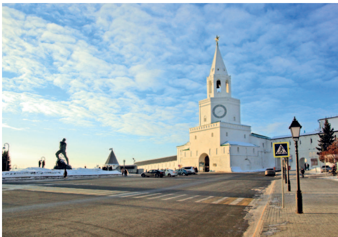
Знакомство с Кремлем начинается со Спасской башни

околожили мощными дубово-каменными стенами толщиной до 9 метров и глубокими рвами. С четырех сторон над стенами возвышались проездные башни: Елабуга, Нур-Али, Большие и Тюменские ворота. В таком виде цитадель простояла больше века, пока в 1552 году после долгой осады она не была взята войсками Ивана Грозного. Руинированную крепость перестроили, заменив все деревянные оборонительные сооружения на каменные.