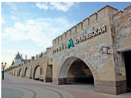
Станция метро «Кремлевская»

Точных данных о том, когда на этом месте появилось первое укрепленное поселение, нет — одни ученые считают, что это произошло еще в X веке, другие называют XII век, однако изначально крепость болгарских князей была деревянной. После 1445 года, когда образовалось Казанское ханство, крепость была укреплена, ее