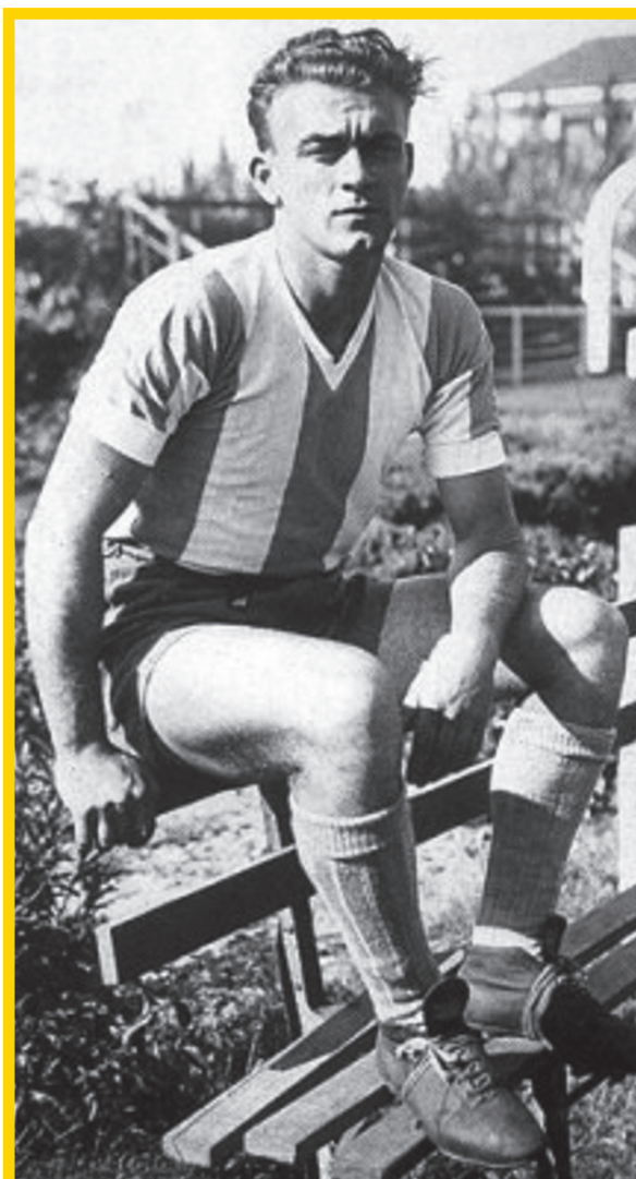
Лидер атак «Реала» Альфредо Ди Стефано

«Бланкос» («сливочные»; так за белый цвет формы прозвали «Реал») приобрели всемирную популярность в 1950-х, когда клуб пять раз подряд выиграл Кубок европейских чемпионов. На родине команда, в которой выступали Альфредо Ди Стефано (авторитетные эксперты признают его лучшим футболистом XX века в эпоху до Пеле), лучший венгерский