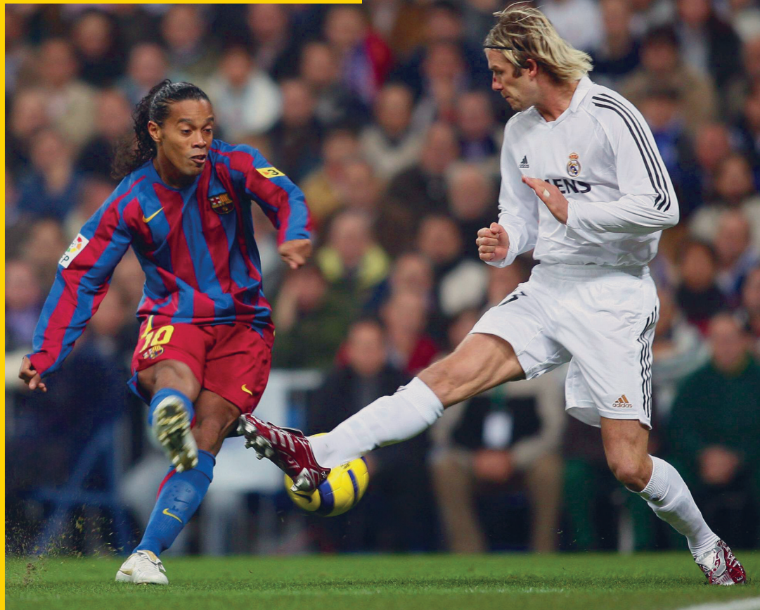
Роналдиньо против Дэвида Бекхэма

Ажиотаж вокруг соперничества «сине-гранатовых» и «сливочных» достиг пика, когда стали участвовать футболисты, со временем