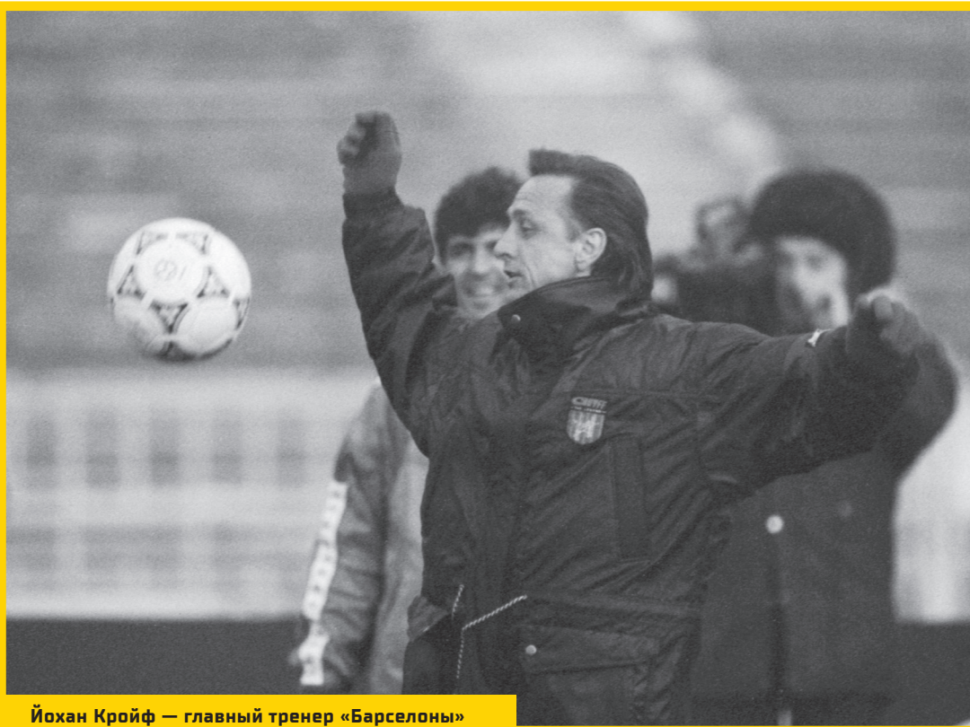
Йохан Кройф — главный тренер «Барселоны»

Но в финале «Милан» оказался сильнее, да еще как: 0:4 стало очень сильным ударом.