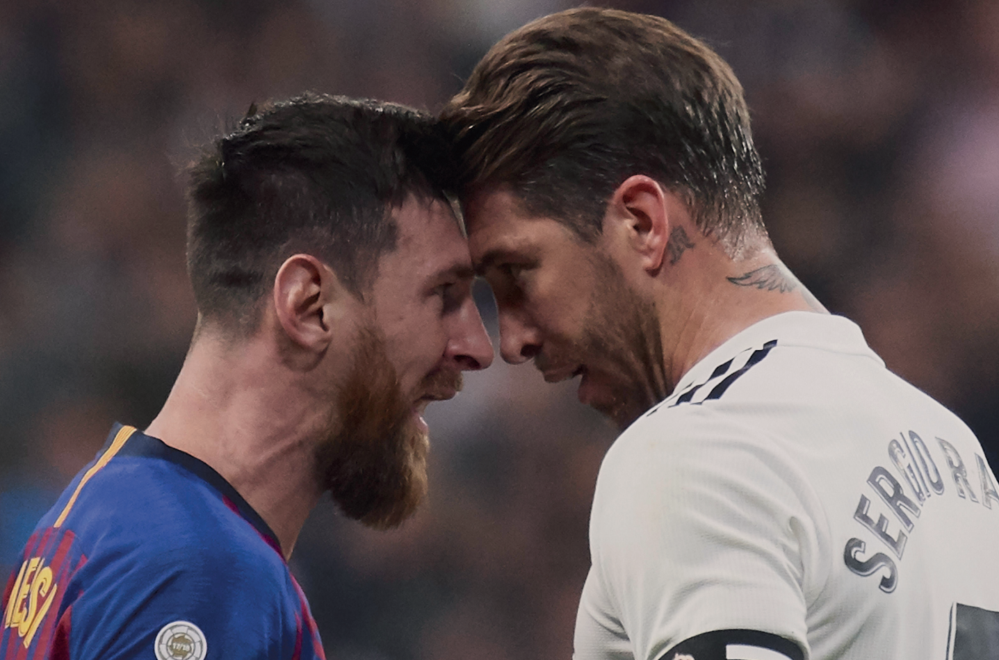
Лео Месси и Серхио Рамос