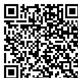
М. Мусоргский. «Картинки с выставки». Пьеса №2, «Богатырские ворота»