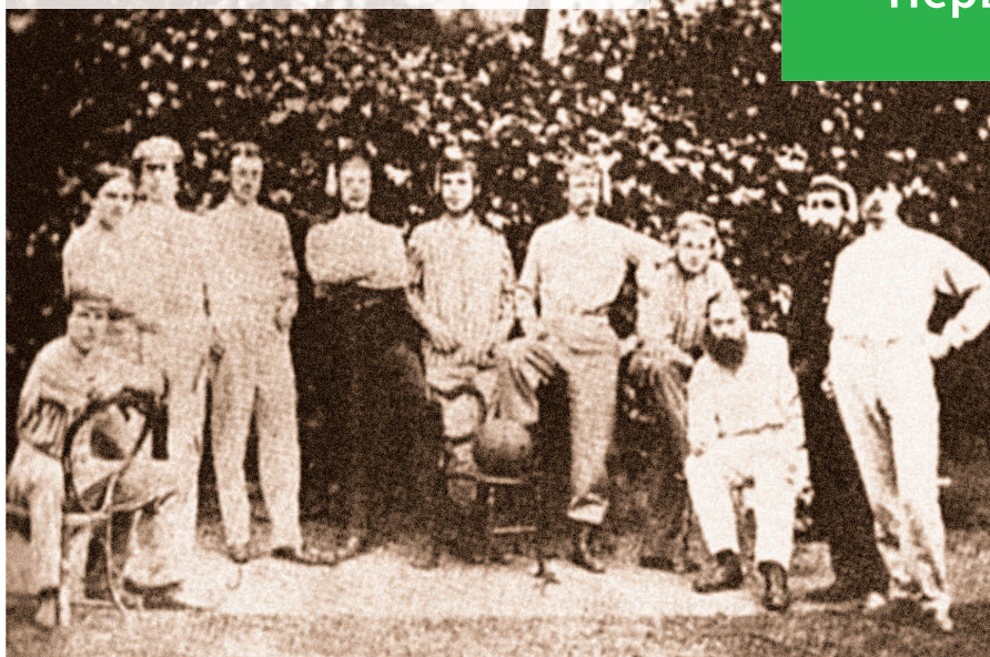
Единственная известная командная фотография футбольного клуба «Форест», позже переименованного в «Уондерерс». 1863 г.