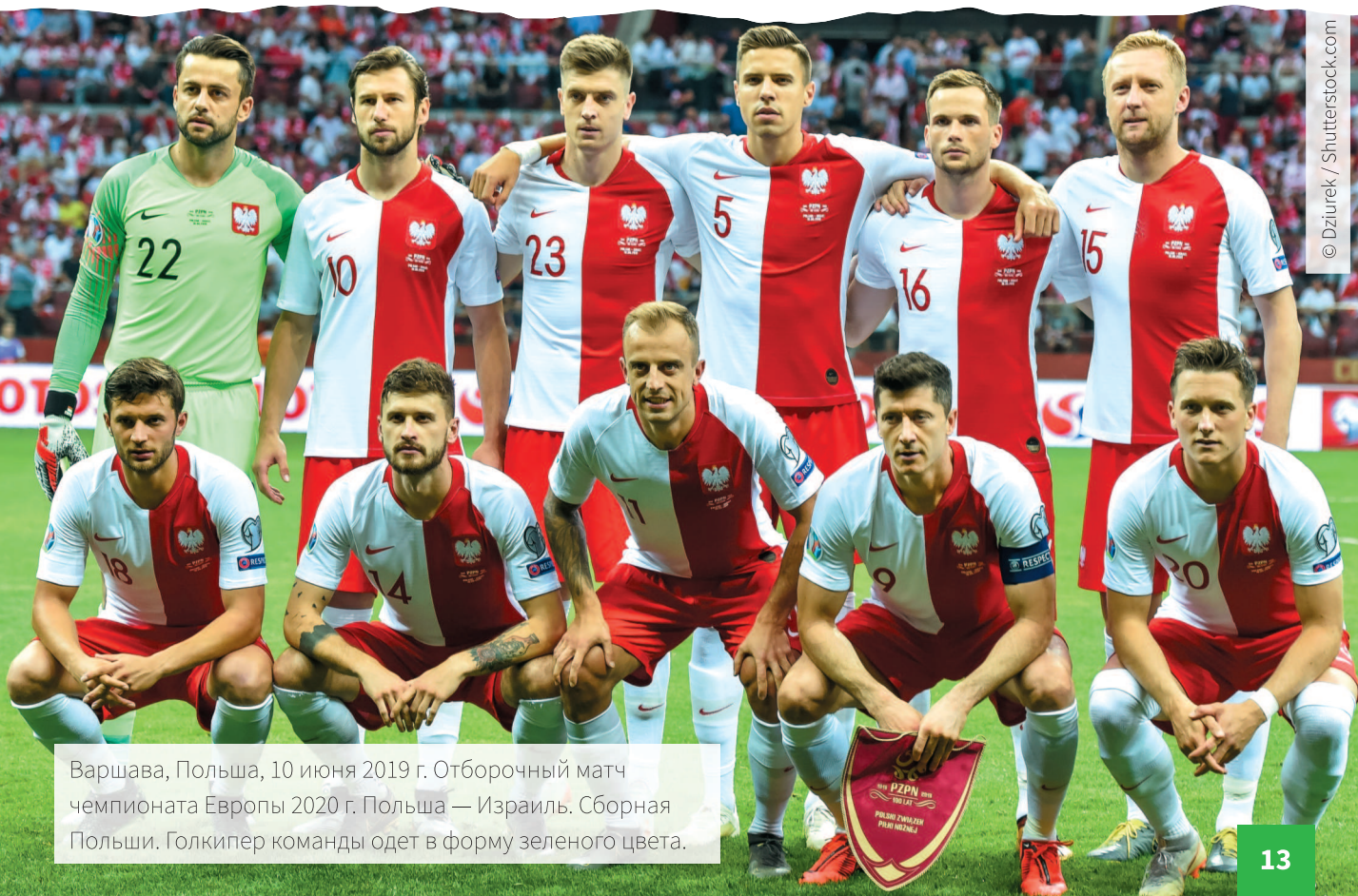
Варшава, Польша, 10 июня 2019 г. Отборочный матч чемпионата Европы 2020 г. Польша — Израиль. Сборная Польши. Голкипер команды одет в форму зеленого цвета.