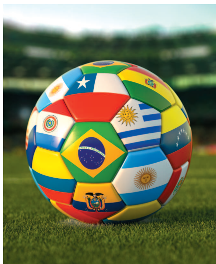
Футбольный мяч с флагами стран Южной Америки.