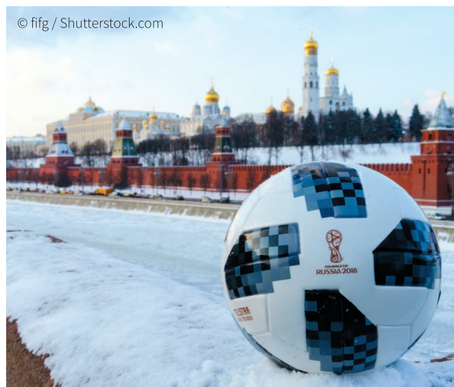
Москва, Россия, 22 января 2018 г. Официальный мяч чемпионата мира по футболу FIFA 2018 Adidas Telstar на фоне Московского Кремля.

Современный футбол пришел в Российскую империю на рубеже XIX–XX веков благодаря английским морякам и иностранным специалистам, работавшим на промышленных предприятиях. Именно они познакомили местных жителей с этой захватывающей игрой. Пионером российского футбола стал Санкт-Петербург, где в 1901 г. была организована первая официальная футбольная лига. Москва последовала этому примеру лишь в 1909 году. Вслед за двумя столицами футбольные объединения начали появляться и в других крупных городах страны, что положило начало системному развитию этого вида спорта в России.