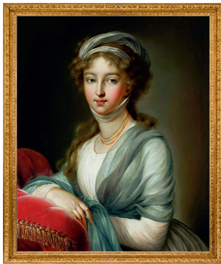
Императрица Елизавета Алексеевна

Супругу Александра I называли российской Психеей: она редко появлялась на балах, но её появление всегда было событием. «Она была хороша собой как ангел, одета в розовое платье, вышитое большими белыми розами. Ни одного бриллианта в распущенных волосах». Пушкин очарован императрицей и, говорят, был безнадежно влюблён в неё: