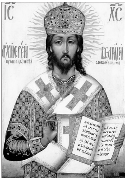
Спас Великий Архiereй