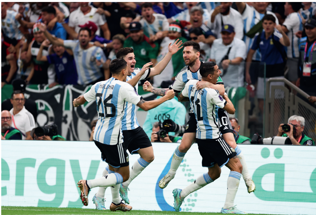
«В ЛЕО ВСЕЛИЛАСЬ ДУША МАРАДОНЫ»