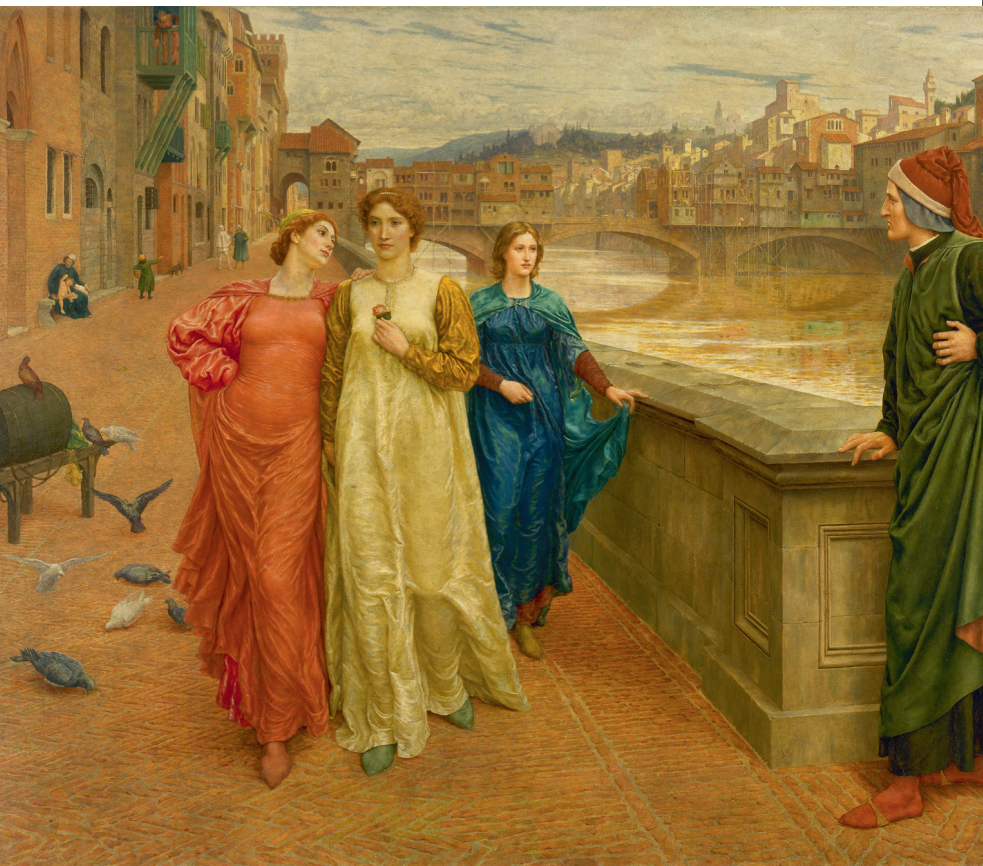
ГЕНРИ ХОЛИДЭЙ. ВСТРЕЧА ДАНТЕ И БЕАТРИЧЕ. 1882-1884