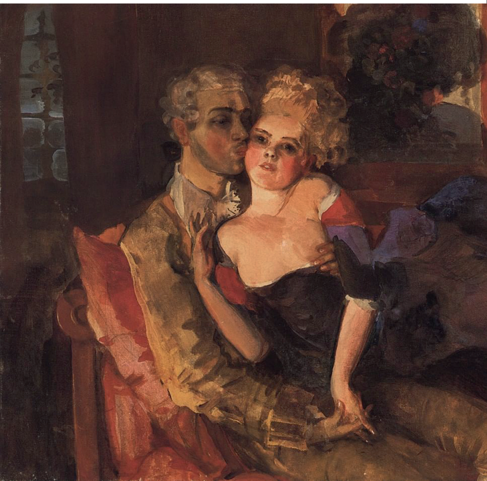
КОНСТАНТИН СОМОВ. ВЛЮБЛЕННЫЕ. ВЕЧЕР. 1910