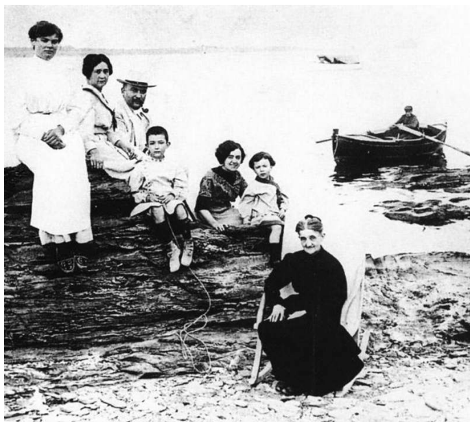
Семья и родители Сальвадора Дали

«Судьба человека неотвратно влечет его к Великому Инквизитору или к Христу. Третьего не дано. Свобода или принуждение, вера в Смысл жизни или неверие, божественная любовь или безбожное сострадание к людям?»