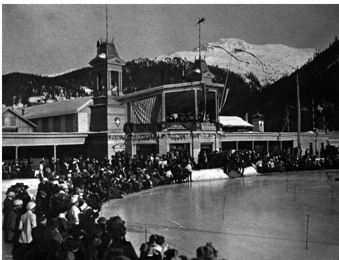
Давос в начале XX века

ми, девушка легко отрекалась от прошлого. И все-таки убежать от себя у нее не получалось. Каждый раз замирая перед зеркалом, Леночка с неудовольствием отмечала в своей внешности отцовскую неприглядность. Нос коршуна, мелкие черты лица, черные точки вместо глаз, неразвитая грудь, болезненная худоба. Создавая ее, творец явно поскупился на краски. Она подобна штриховому наброску, выполненному второпях незадачливым художником.