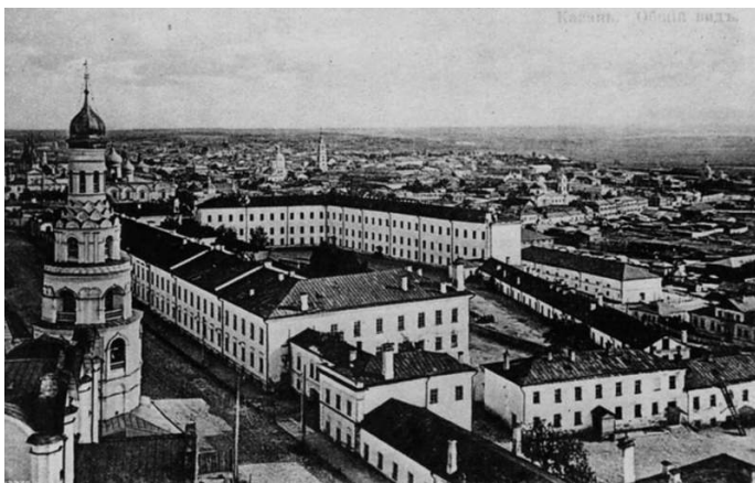
Казань в начале XX века

Покидая Казань с ее узорными башенками, белокаменными стенами и синеокими кастровыми озера-