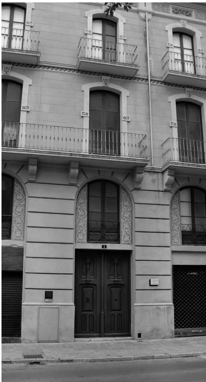
Дом, в котором родился Сальвадор Дали