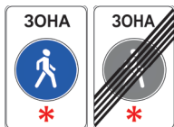
5.33 Пешеходная зона 5.34 Конец пешеходной зоны

« Пешеходная и велосипедная дорожка (велопешеходная дорожка) » — конструктивно отделенный от проезжей части элемент дороги (либо отдельная дорога), предназначенный для раздельного или совместного с пешеходами движения велосипедистов и лиц, использующих для передвижения средства индивидуальной мобильности, и обозначенный знаками 4.5.2–4.5.7.