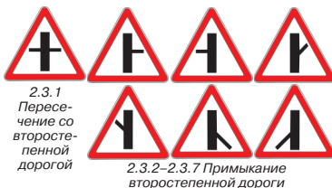
2.3.1 Пересечение со второстепенной дорогой