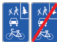
5.39 и 5.40 Начало и конец велосипедной зоны

« Маршрутное транспортное средство » — транспортное средство общего пользования (автобус, троллейбус, трамвай), используемое при осуществлении регулярных перевозок пассажиров и багажа в соответствии