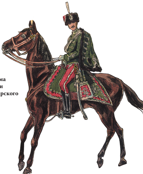
Военная форма лейб-гвардии Гродненского гусарского полка