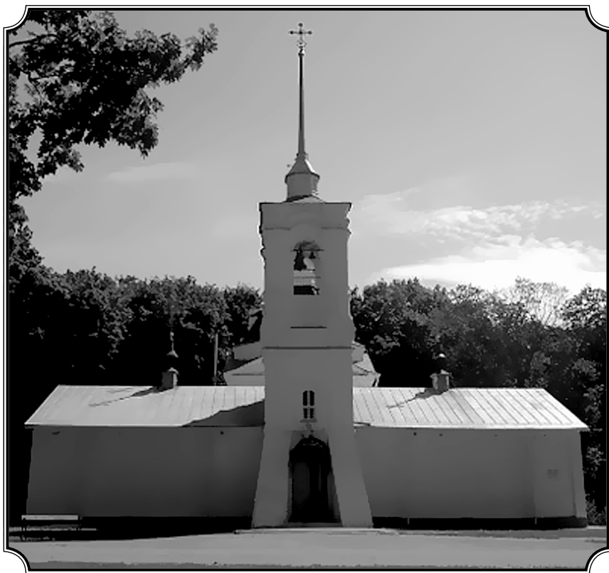
Преображенская церковь в усадьбе Скобелевых. 1763 г. Современная фотография

разные мнения — товарищи ценили в нем выдающегося человека, начальство считало способным, но ленивым. Подобная оценка являлась вполне естественной. Как и большинство даровитых людей, он не мог подходить под общую мерку. Заниматься одинаково внимательно всем, что требовалось академической программой, он не мог. Но зато, зачастую собрав вокруг себя своих сотоварищей по академии, Скобелев читал им какую-нибудь им составленную записку, касавшуюся походов Наполеона или каких-либо эпизодов из русской военной истории. Подобное чтение всегда увлекало слушателей, вызывая оживленные споры и рассуждения.