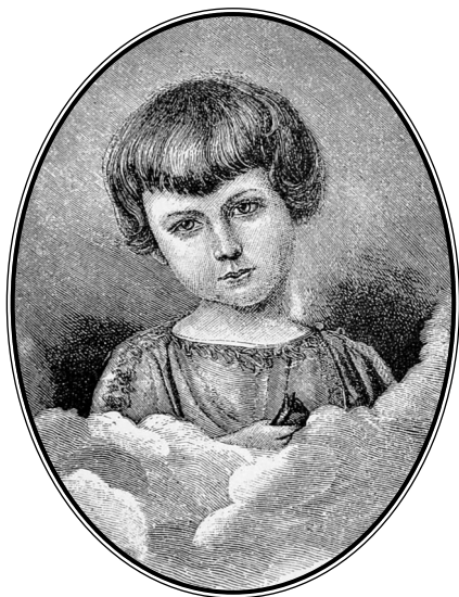
Михаил Дмитриевич Скобелев в детстве. Литография 1913 г.

Решение служить на нашей окраине в Средней Азии как нельзя больше согласовалось со взглядами Скобелева на военное дело и с его вечно жаждущей острых, новых ощущений натурой. Только здесь он мог пройти на практике боевую школу, только тут мог быть удовлетворен его мятежный дух.