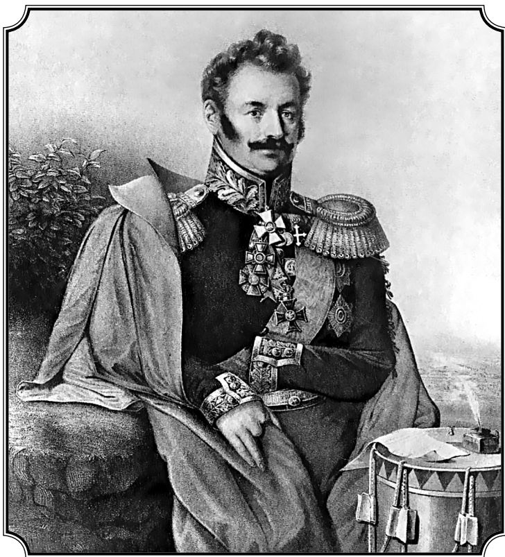
Иван Никитич Скобелев. Литография 1820 г.