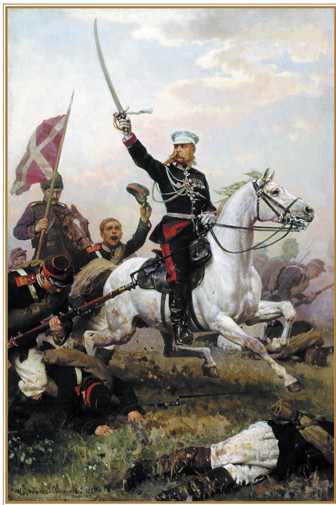
Н. Д. Дмитриев-Оренбургский. Генерал М. Д. Скобелев на коне. 1883 г.