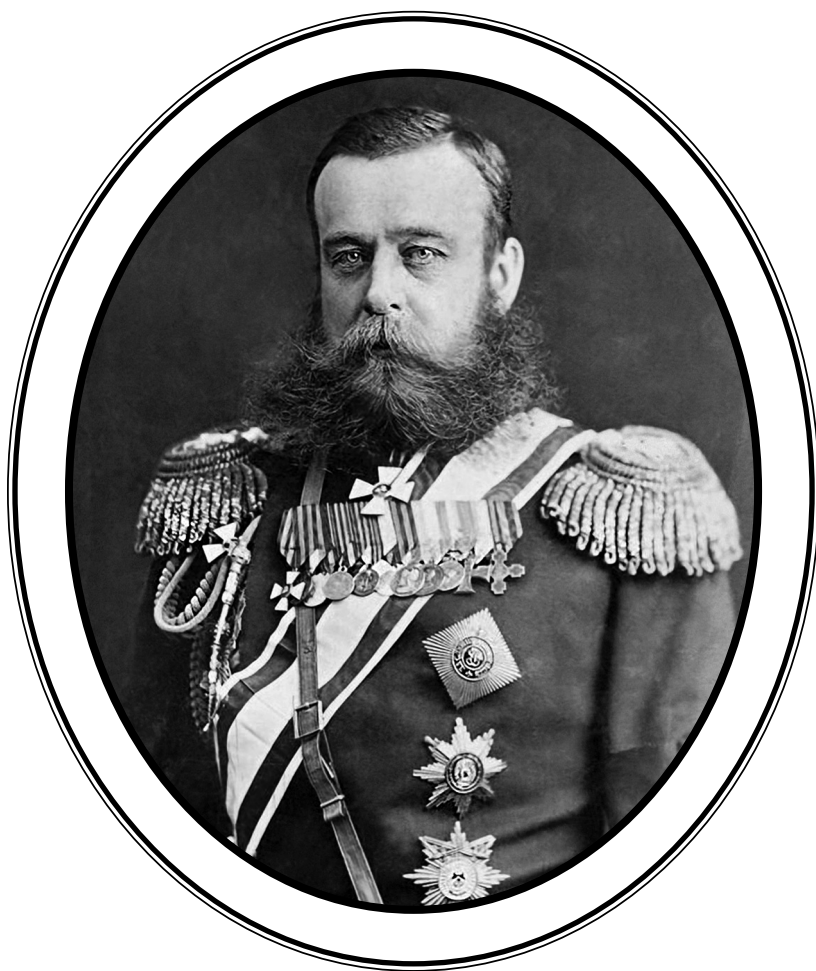
Михаил Дмитриевич СКОБЕЛЕВ