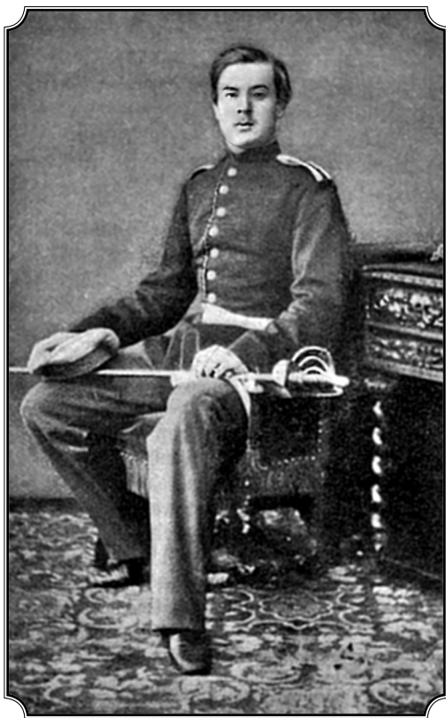
Михаил Дмитриевич Скобелев в чине юнкера.

«В апреле началось движение войск эшелонами. Сначала я находился при одной из колонн и исполнял разные поручения. У колодцев Баш-Акта мне поручено было командование отдельной небольшой колонной. Подвигались вперед мы медленно, испытывая страшные лишения: жара доходила до 45°, духота и сухость воздуха были невыносимы; кругом, куда ни бросить взор, безжизненная пустыня, бесконечные пески, пески. Вода в колодцах была большею частью скверная, солоноватая; колодцы глубоки, иногда