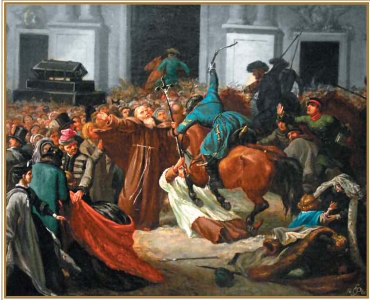
Разгон демонстрации польских патриотов русскими казаками (27 февраля 1861 г.).