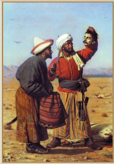
В. В. Верещагин. После удачи. 1868 г.