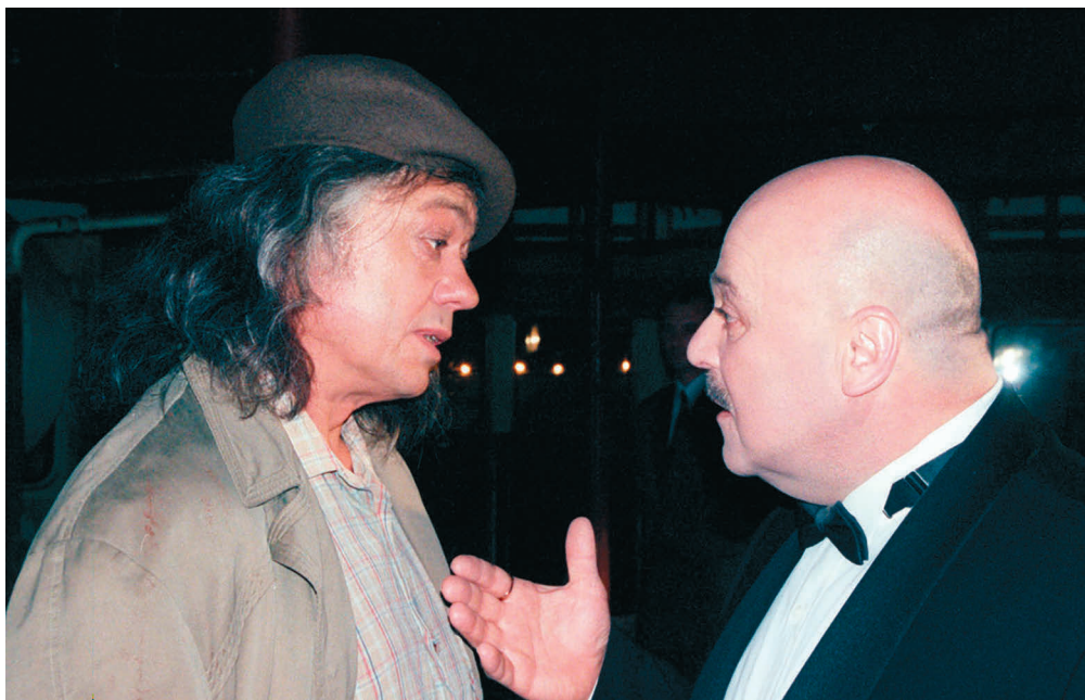
Николай Караченцов и Александр Калягин в спектакле «Чешское фото»