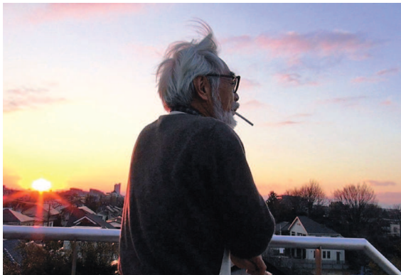
Бесконечный человек: Хаяо Миядзаки.

«Конан — мальчик из будущего» ( Mirai shônen Conan , см. стр.122) Аниме-сериал, Nippon Animation Художник-мультипликатор, художник-постановщик