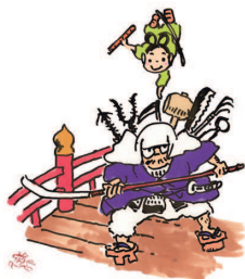
Рисунок Хаяо Миядзаки к спектаклю «Навиская из долины ветров».

Дебютировав в японской студии Toei Animation, Миядзаки прошел всю цепочку производства манги и анимации. Благодаря своему невероятному трудолюбию аниматор получил богатейший опыт, который лег в основу его творчества, опирающегося на японские и европейские мифы и обращенного к людям всех возрастов и национальностей. Своим примером он показал тысячам начинающих мультипликаторов, что можно творить, не стесняясь своих амбиций.