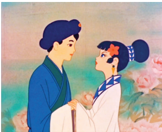
Кадр из мультфильма «Легенда о Белой Змее», 1958 год.

«В пору детства я был, как говорится, хорошим мальчиком. Я не делал то, что хотел, потому что пытался соответствовать ожиданиям родителей. <...> Когда я впервые увидел «Легенду о Белой Змее» 1 , у меня как будто открылись глаза; я понял, что хочу <...> рисовать мангу, которая говорила бы детям: “Дети, не дайте родителям задушить вас в объятиях” или “Перестаньте зависеть от своих родителей”» 2 . В этой речи, произнесенной в июне 1982 года в университете Васэда в Токио, Миядзаки объясняет, что в начале творчества ему было важно поощрять детей расти самостоятельно, не обращая внимания на обязательства и ожидания родителей.