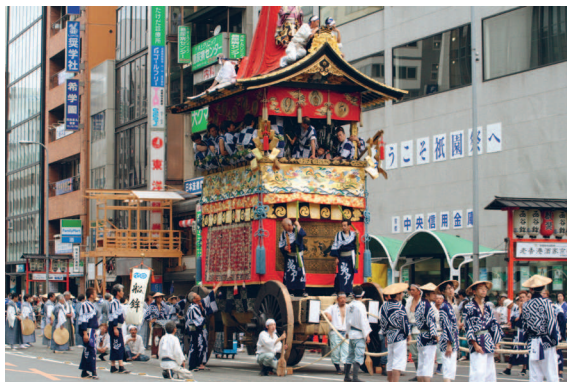
Платформа во время парада гигантских паланкинов Гион Мацури в Киото, одного из многочисленных японских фестивалей, 2009.

Я был слишком робким, и моя мать была такой же. Когда я навещал ее в больнице, не мог заставить себя сразу подойти к ней и поцеловать». В мультфильме мать Сацуки показывает привязанность к дочке, глядя ее по волосам, но Миядзаки с матерью так и не нашли способа выразить свои взаимные чувства. Несмотря на то что режиссер отказывается считать «Моего соседа Тоторо» исключительно ностальгическим произведением, мультфильм во многом вдохновлен его собственными детскими переживаниями о болезни матери. Раннее взросление Сацуки, ее забота о младшей сестре и помощь по хозяйству взяты из личного опыта Миядзаки 1 . Он вспоминает: «Когда мать лежала в больнице, а я возвращался из школы в пустой дом, я испытывал настоящее одиночество... [Сацуки] пришлось стать более взрослой и сильной, как это свойственно детям в таких ситуациях. <...> Десятилетний ребенок может управиться с работой по дому. Я управлялся. Я убирался, топил баню и готовил».