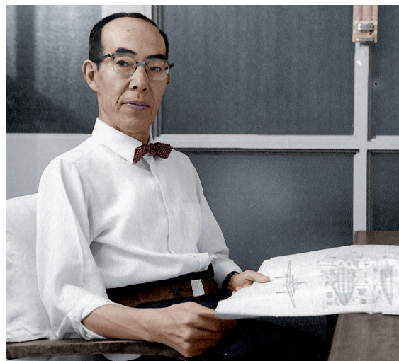
Дзиро Хорикоси (портрет).

Несмотря на то что Хаяо Миядзаки тщательно скрывает личную жизнь от посторонних глаз, она так или иначе проскальзывает во многих его произведениях. Наиболее явно она проявляется в од-