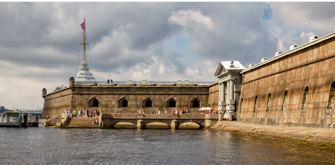
Пристань крепости и флагшточная башня со стороны Невы

16 (27) мая 1703 года вошло в историю как день рождения нового города. На Заячьем острове закладывают крепость по последнему слову фортификационной науки. Шесть выступов-бастионов, соединенных стенами-куртинами, образовали мощное укрепление. Каждый бастион был позднее назван в честь Петра и его сподвижников. Государев, Меншиков, Головкин, Зотов, Трубецкой, Нарышкин. Первоначально крепость была дерево-земляной, перестраивать ее в камне стали уже после смерти Петра. Но даже в своем первоначальном виде она весьма впечатляла! А вскоре прошла испытание боем. Вернее, не совсем боем: в 1705 году шведы попытались атаковать крепость, но в итоге с позором отступили, даже не сумев подойти вплотную. Больше попыток штурма не последует — новая твердыня навсегда закрыла врагам путь в Неву, ясно дав понять: шведам здесь больше делать нечего. Параллельно в Финском заливе строились форты еще одного укрепления — города-крепости Кронштадта, который окончательно перекрыл врагам водные подступы к Санкт-Петербургу со стороны Балтики.