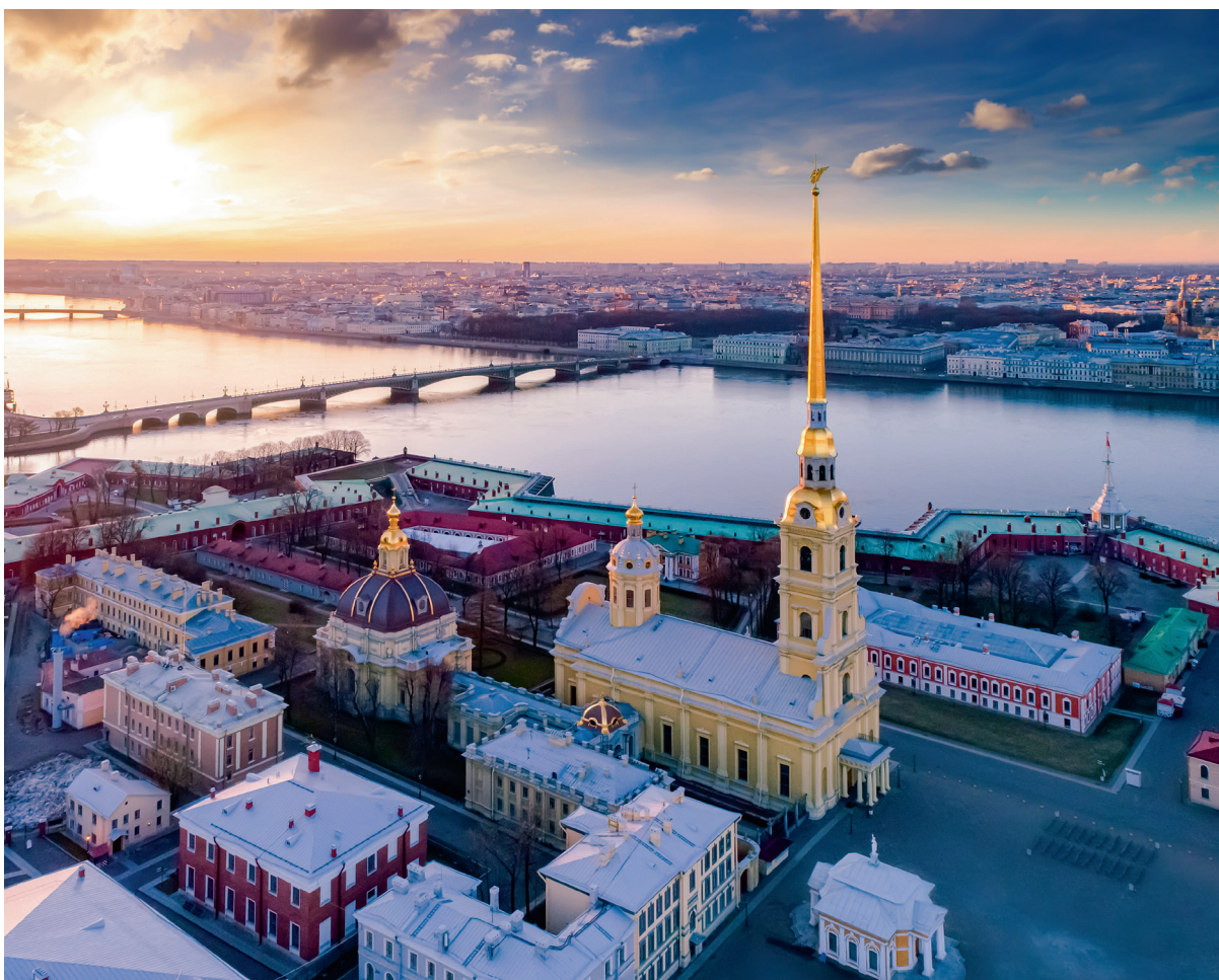
Постройки внутри Петропавловской крепости с высоты птичьего полета

Со временем закрепилось название крепости «Петропавловская», а Санкт-Петербургом начали называть растущий вокруг крепости город. Сам царь называет его Парадиз (рай), поэты величают Северной Пальмирой, а в народе чуть позже родился панибратски-ласковый вариант — Питер, который сейчас, кстати, сильно раздражает коренных петербуржцев. Пройдет несколько лет, и Петропавловский собор начнут перестраивать в камне. Колокольню увенчает многометровый шпиль с фигуркой ангела, несущего крест: в девятнадцатом столетии, после очередной пере-