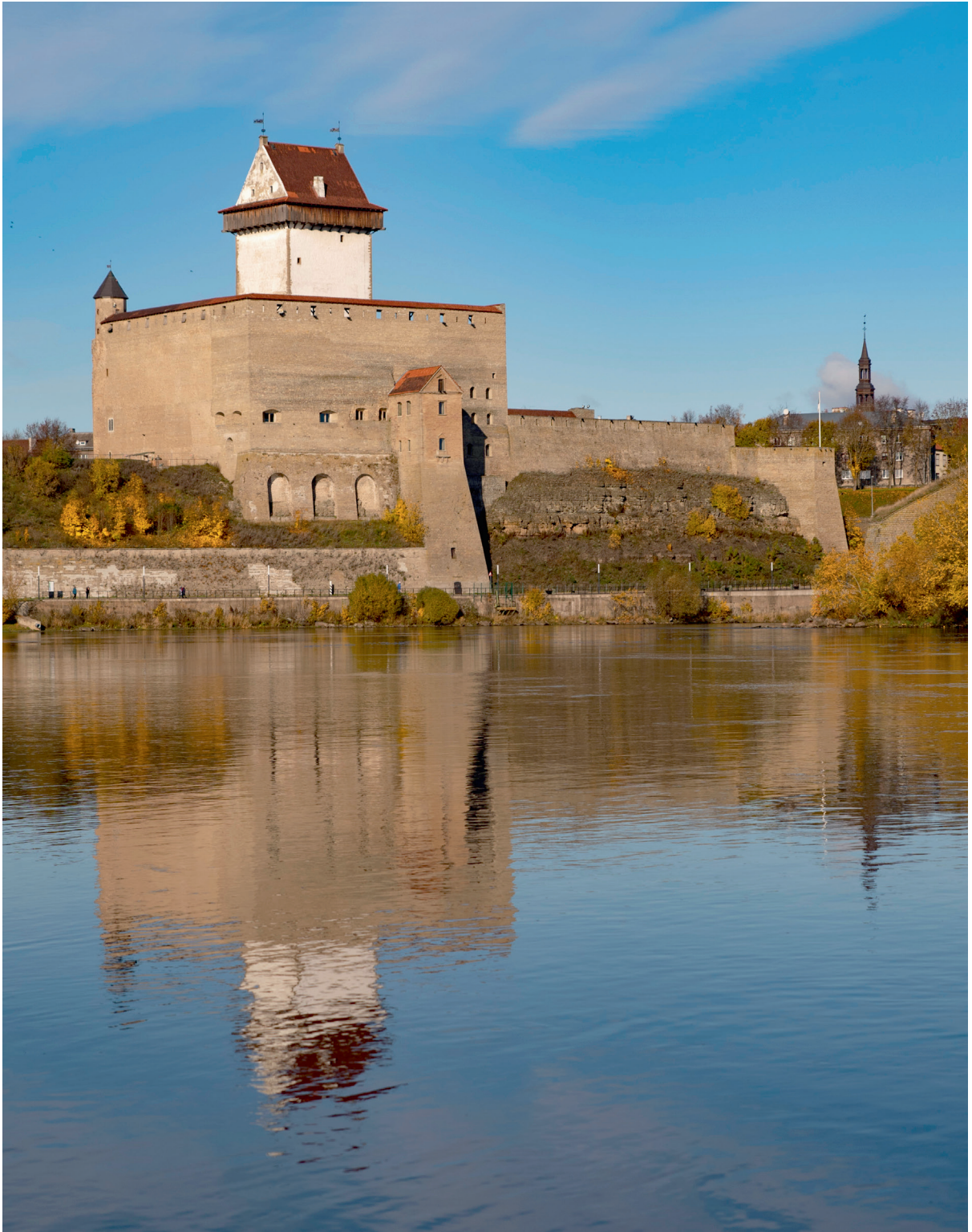
Нарвский замок, у стен которого произошло сражение 1700 года