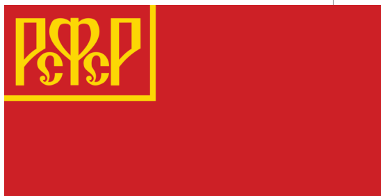
Государственный флаг РСФСР (1918–1937)

А 7 июля 2013 года во Владивостоке 26 900 горожан выстроились на мосту через бухту Золотой Рог с красными, синими и белыми флажками в руках, и они воссоздали 707-метровый флаг России. Данное событие попало в Книгу рекордов Гиннеса как самый большой «живой» флаг в мире.