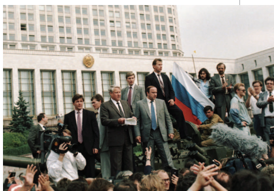
Б.Н. Ельцин на фоне исторического флага России. Август 1991