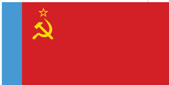
Флаг РСФСР (1954–1991)