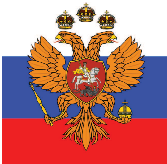
Флаг царя Московского