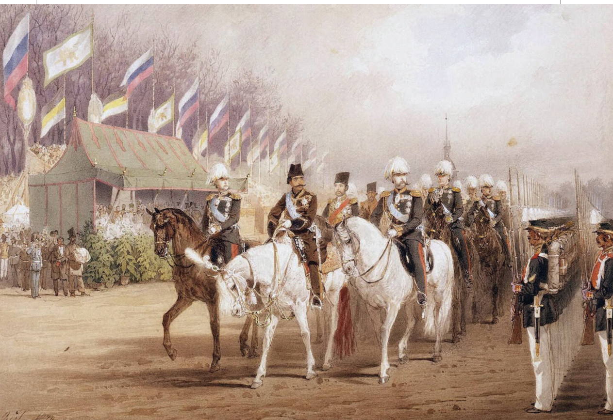
Михай Зичи. Александр II и Насир-ад-Дин Шах во время парада на Царицыном лугу. 1873

решение не было обнародовано в течение двух лет. Соответственно, коронация Николая II прошла со множеством бело-сине-красных флагов, хотя черно-желто-белые полотнища также использовались для украшения.