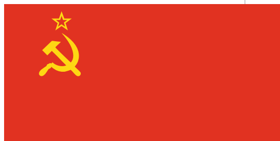
Флаг СССР (1924–1991)