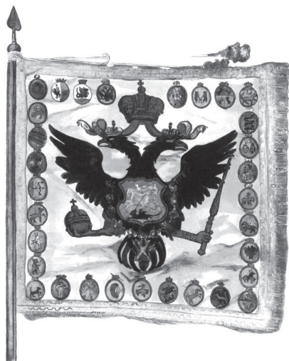
Государственное знамя, созданное к церемонии коронации Елизаветы Петровны (1742)