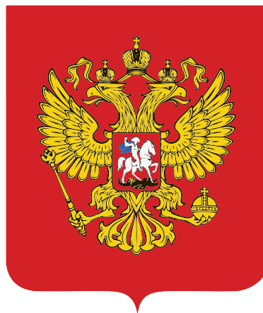
Государственный герб Российской Федерации

Славься, Отечество наше свободное, Братских народов союз вековой, Предками данная мудрость народная! Славься, страна! Мы гордимся тобой!