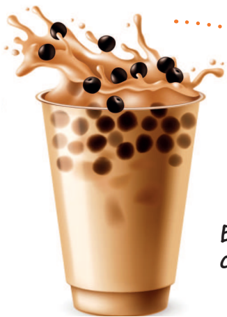
Бабл-ти с тапиокой

Это напиток на основе чая с молоком, с добавлением тапиоки или желейных шариков с соком внутри.