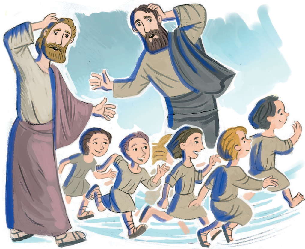
Рисунки Юрия Пронина