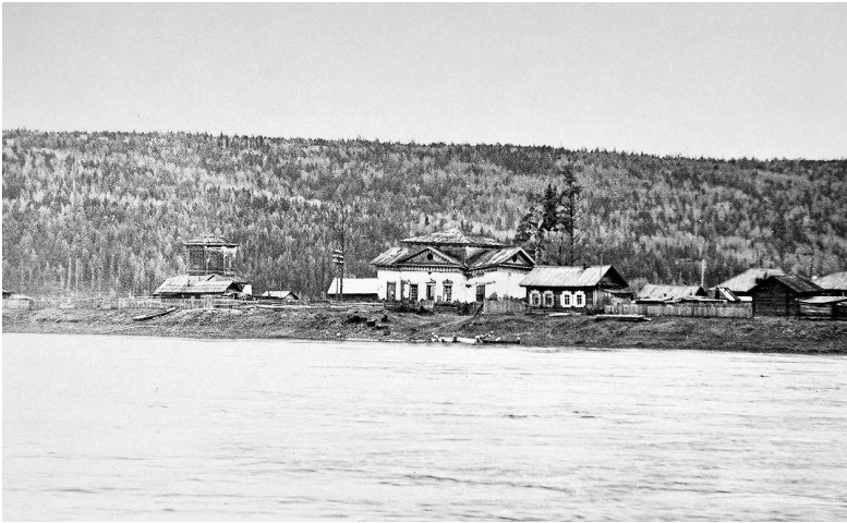
Деревня Чугуево, где родился Фёдор Григорьевич Углов

ние между населенными пунктами и их снабжение всем необходимым осуществлялось исключительно по воде. Зимой, когда реки замерзали, прокладывали санный путь.