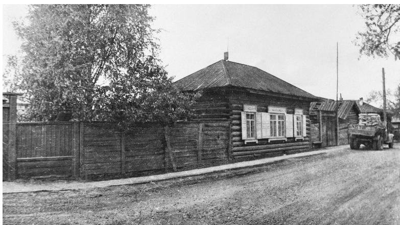
Дом Угловых в Киренске

Создавались регулярные воинские формирования, получившие название Белой армии. В Сибири, в частности в Иркутской области, власть взял адмирал Александр Васильевич Колчак (1874–1920) — бывший известный полярный исследователь, бывший командующий Черноморским флотом (при царском режиме). Участник русско-японской войны 1904–1905 годов,