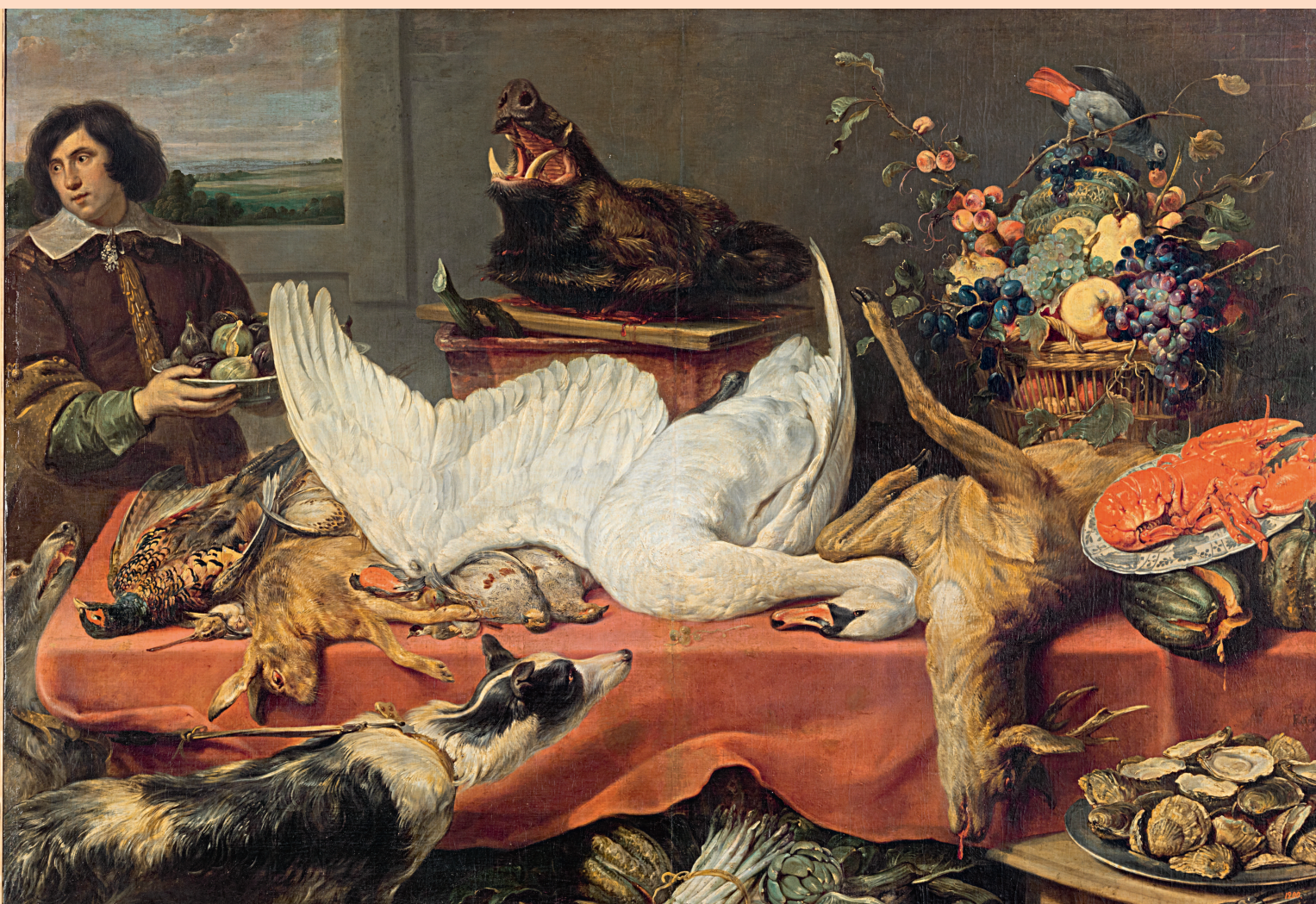
Франс Снейдерс Натюрморт с лебедем 1640-е гг.

Нету большего контраста: «Живописец — натюрморт»... Как бы выглядел прекрасно Натюрморт-наоборот.