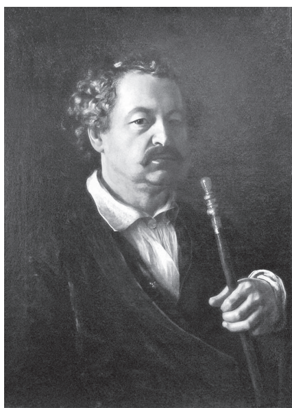
Александр Александрович Алябьев

Кто удосуживается вспомнить при этом, например, о том, что стихотворение Антона Дельвига, на которое Алябьев написал музыку (о том, при каких обстоятельствах это произо-