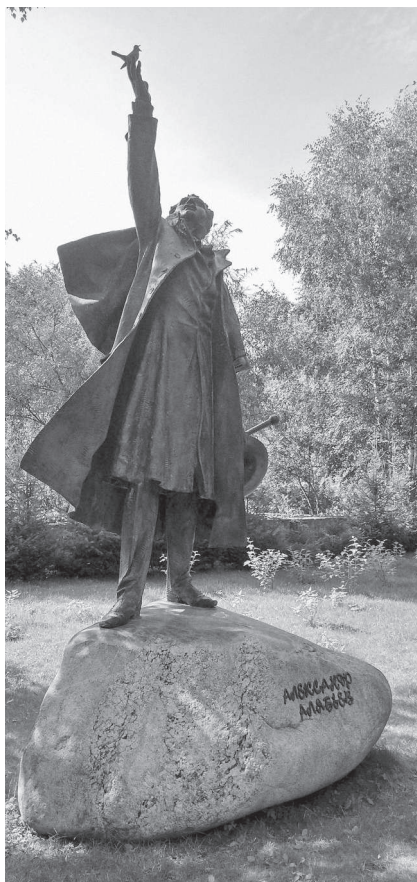
Памятник Алябьеву в Тобольске

Побывай во всех странах, В деревнях и городах: Не найти тебе нигде Горемычнее меня. Соловей мой, соловей, Голосистый соловей