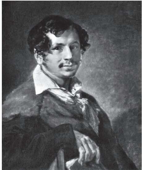
Петр Булахов — первый исполнитель романса «Соловей»