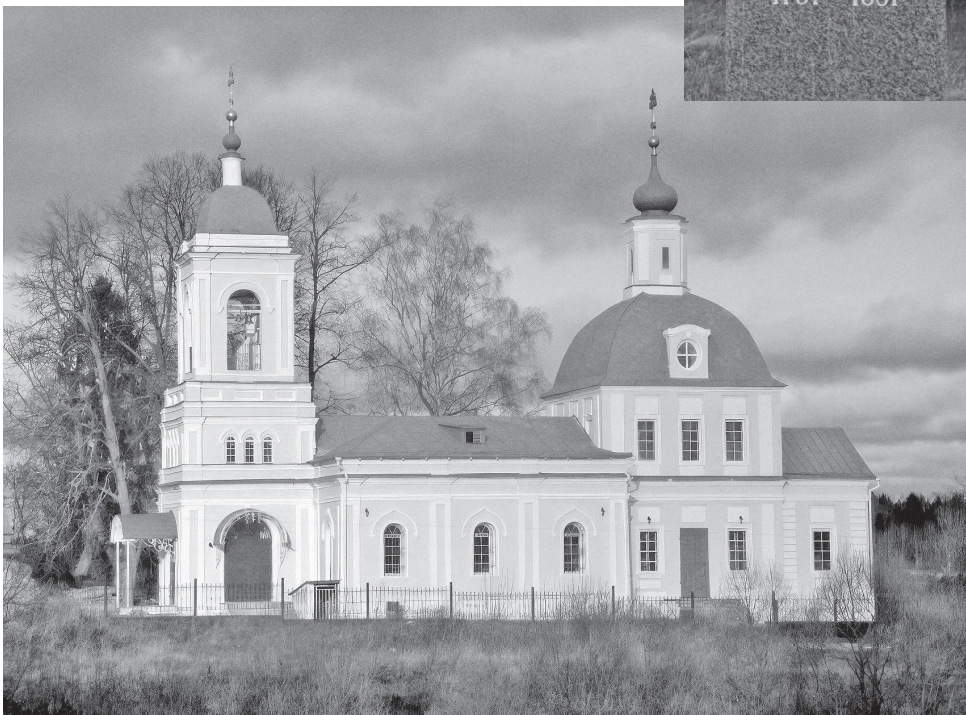
Троицкая церковь в усадьбе Рязанцы Щёлковского района Московской области