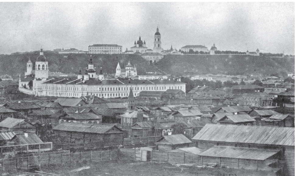
Вид Тобольска. 1862

Службу-то Алябьев оставил, а вот гусарские привычки к картам, вину и прекрасным дамам — увы... Они-то и сломали его жизнь. Есть разные версии того, что произошло 24 февраля 1825 года то ли на почтовой станции Чертаново в окрестностях Москвы, то ли дома у Алябьева. Происшествие это, в частности, описано в романе Алексея Писемского «Масоны».