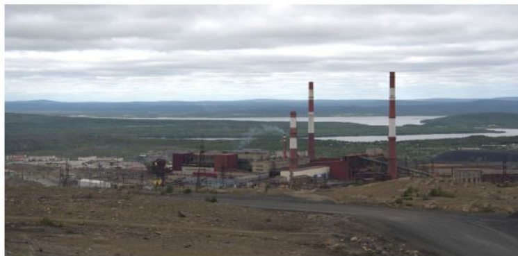
▼ Панорама города и градообразующего предприятия