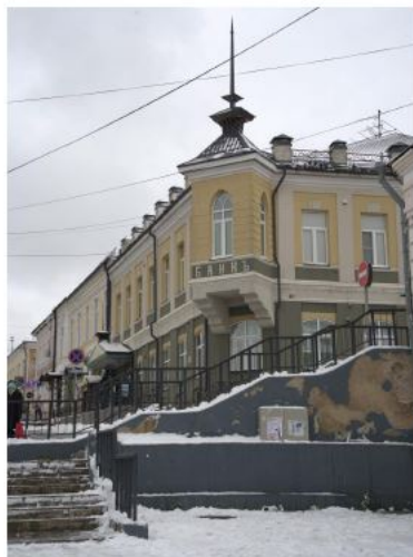
▲ Бывший банк, а ныне музей