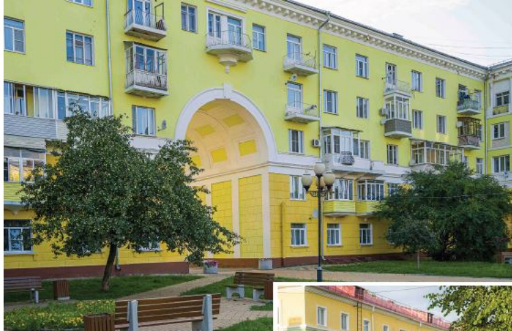
▲ Дом с аркой на проспекте Победы

виться в исторический центр города. Большая часть застройки – образцовые многоэтажки 1950-х годов, которые выглядят очень ухоженно.