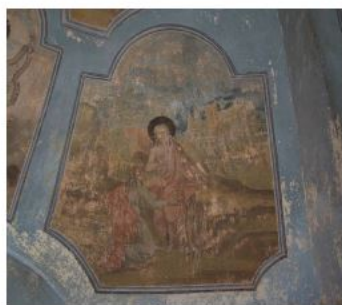
Интерьеры Благовещенской церкви