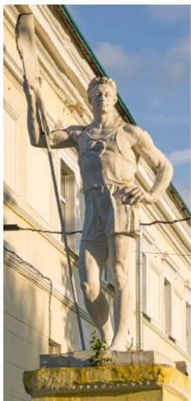
▲ Скульптуры у стадиона