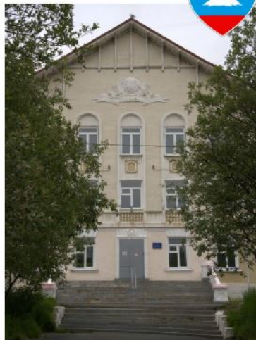
▲ Здание школы

Поселок Колосёйки был основан в 1930-е, когда финские геологи (в то время территория входила в состав Финляндии) нашли в этих местах залежи медно-никелевых руд. После войны поселок отошел Советскому Союзу и сменил имя на современное. До 2020 года здесь работал горно-металлургический комбинат, который не очень хорошо влиял на экологию. Сегодня здесь сохранилось множество артефактов XX века – от еще финских конструктивистских домов конца 1930-х и аутентичных сталинских общественных зданий до дворовых скульптур и мозаик. Отдельного внимания заслуживает местный краеведческий музей. Туда действительно стоит зайти, взять экскурсию и насладиться. Потрясающая экспозиция была собрана благодаря директору и настоящему подвижнику Евгению Маручоку.