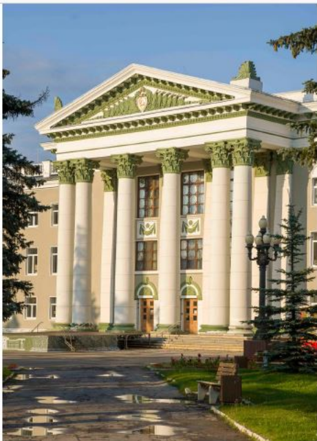
▲ Дворец культуры