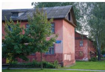
▼ Исторические кварталы