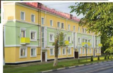
▲ Городская застройка

По пешеходному проспекту Победы дойдем до главной площади, где одну сторону занимает монструозный Дворец культуры. Он был задуман архитектором Б. Желткевичем в 1930-е в форме самолета, по последней моде того времени. Но война помешала работам, а автор проекта погиб при бомбардировке Москвы, поэтому в 1950-е на старом фундаменте вырос огромный дворец, больше похожий своими размерами на здание областного правительства. Напротив расположено здание администрации, а за ним спряталось небольшое здание с балкончиками – это старый конструктивистский дом горсовета. Двигаясь дальше по пешеходному проспекту, можно увидеть оригинальные дома с башенками и арками, построенные еще до войны архитектурно-планировочной мастерской Моссовета. А свернуть на улице Горького налево стоит ради городской бани, больше похожей на театр.