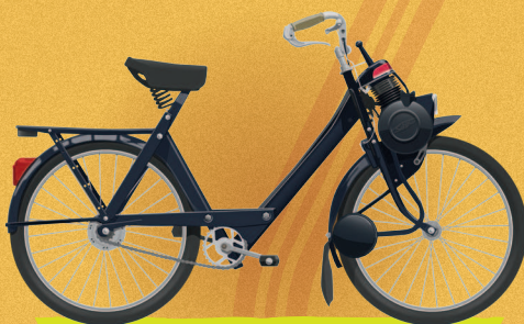
МОТОВЕЛОСИПЕД VÉLOSOLEX 3800