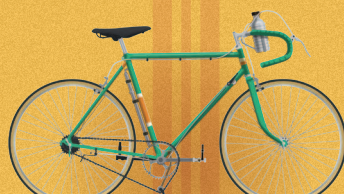
ГОНОЧНЫЕ И ТРЕКОВЫЕ ВЕЛОСИПЕДЫ