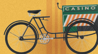
ПРОФЕССИОНАЛЬНЫЕ ДВУХ- И ТРЁХКОЛЁСНЫЕ УСТРОЙСТВА