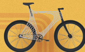
ВЕЛОСИПЕДЫ НАСТОЯЩЕГО И БУДУЩЕГО