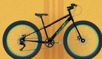
ВЕЛОСИПЕДЫ ДЛЯ ГОРОДА И БЕЗДОРОЖЬЯ