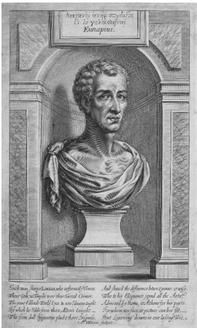
Уильям Фэйторн, «Лукиан Самосатский» (1711)

и богинях — во всяком случае, это справедливо, когда мы говорим о Европе. Например, именно так обстоит дело с древнегреческой мифологией. Но проблема в том, что все известные нам кельтские мифы — продукт христианской эры: они были записаны в Средние века или даже позже. Архаические кельтские легенды, в отличие от греко-римских, не сохранились в том виде, в каком их рассказывали до прихода христианства люди, поклонявшиеся древним божествам. Конечно, это не означает, что у древних племен, говоривших на кельтских языках, не было богатой мифологии: безусловно, она существовала. Но до нас не дошла, потому что в те века никто не записывал истории, а если и записывал, то документы эти не сохранились.